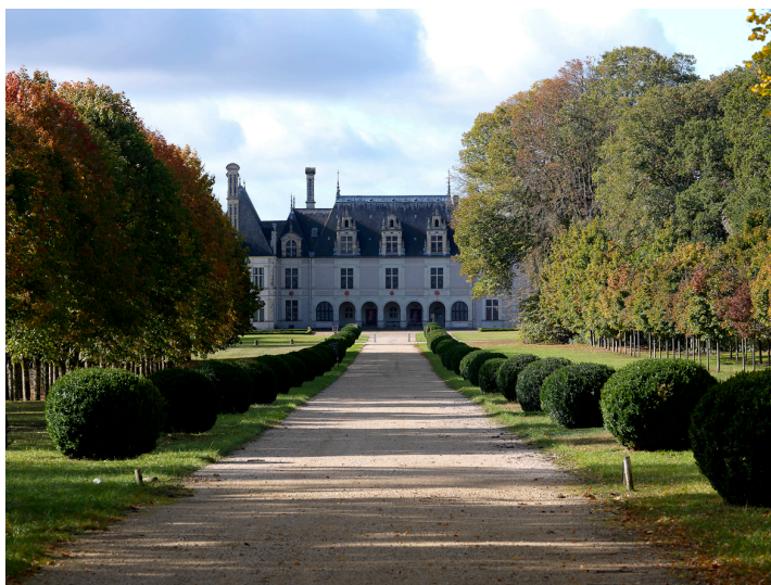
Façade allée Chambord