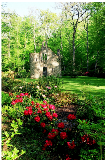
Chapelle XV e siècle