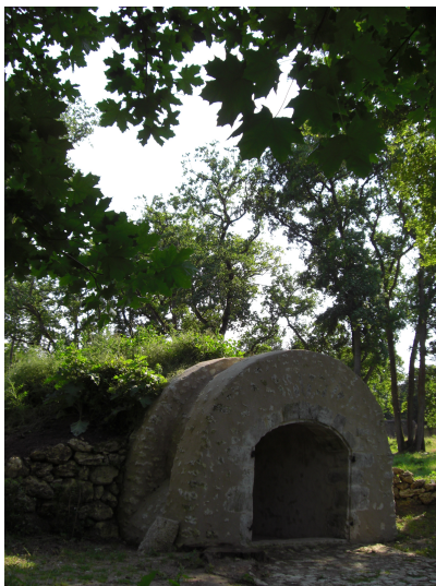
Galcière parc