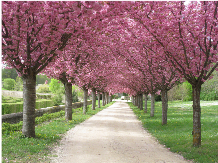
Allée des prunus