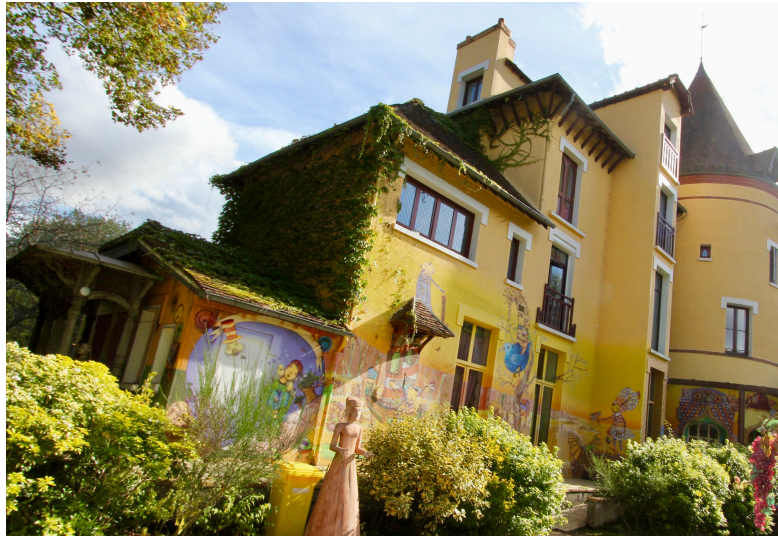
Fresque de Os Gemeos