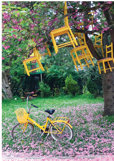
Hanami réduit