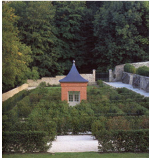
Le labyrinthe aux mille buis