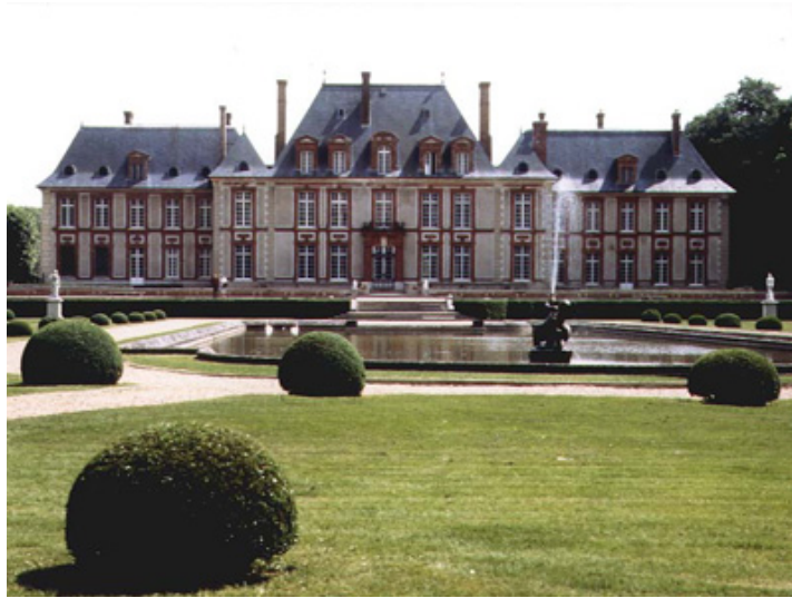
Le jardin à la Française et son miroir d'eau.