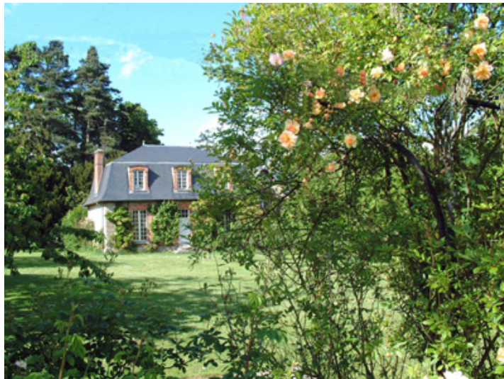
Le jardin des Princes (fruitiers et plantes vivaces)