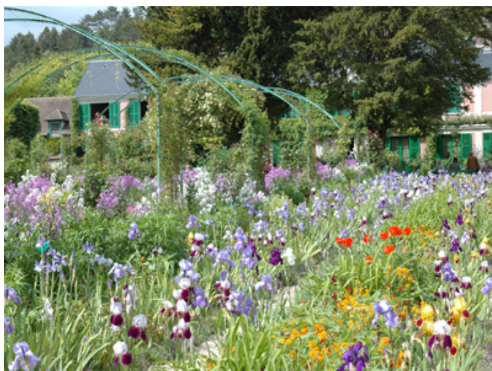
JARDIN CLAUDE MONET