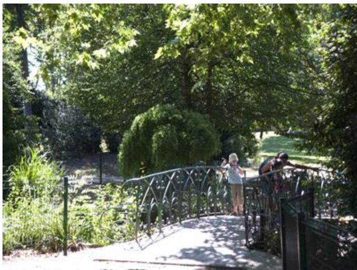
PARC DE ROCHEGUEDE TARN - MIDI PYRENEES