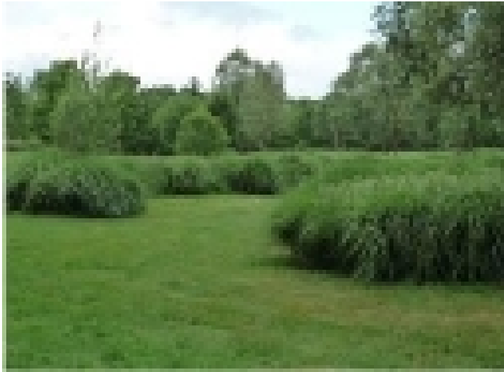
Le couloir des graminées.