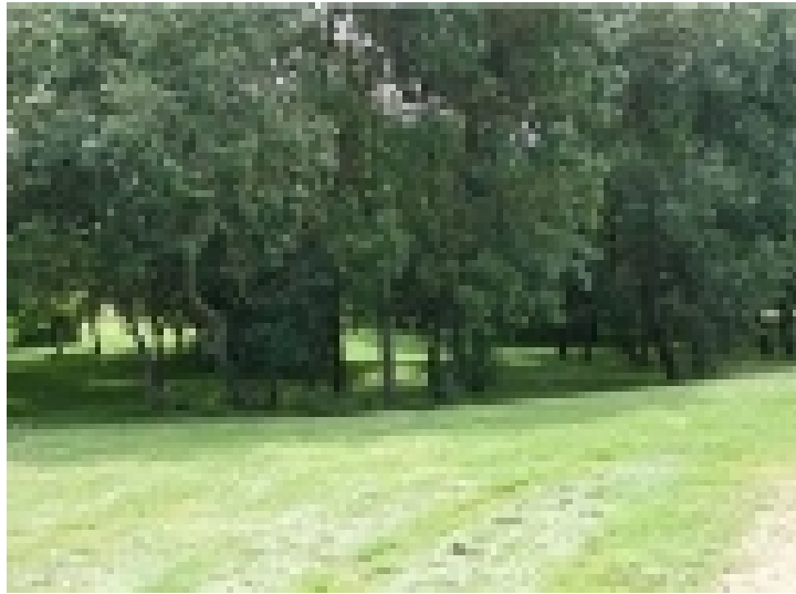
Le verger aux oiseaux.