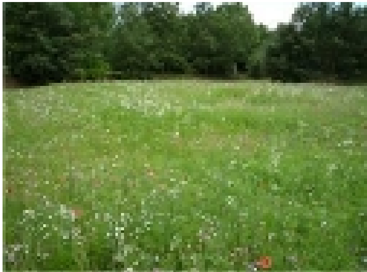
Le Champ Fleuri.