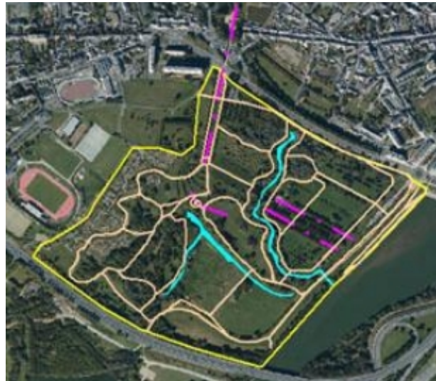
Photographie aérienne 2008 retravaillée en 2009.