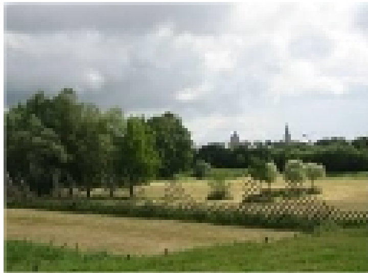
Les basses prairies.