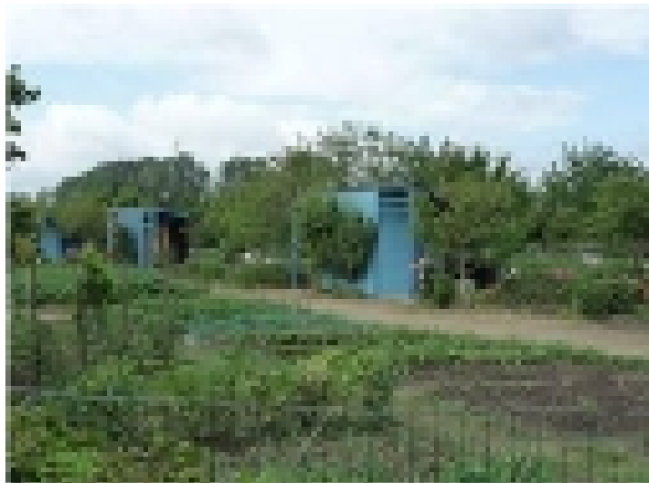
Les jardins familiaux.