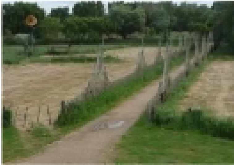
Les basses prairies.