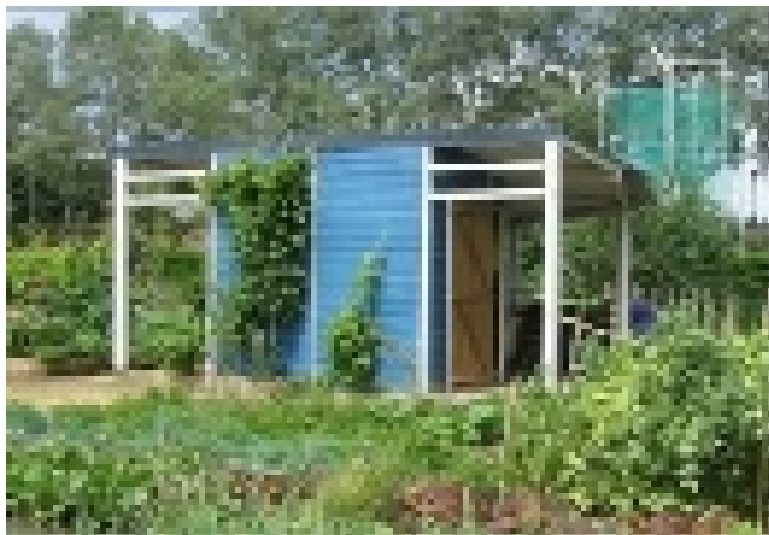
Local des jardins familiaux.