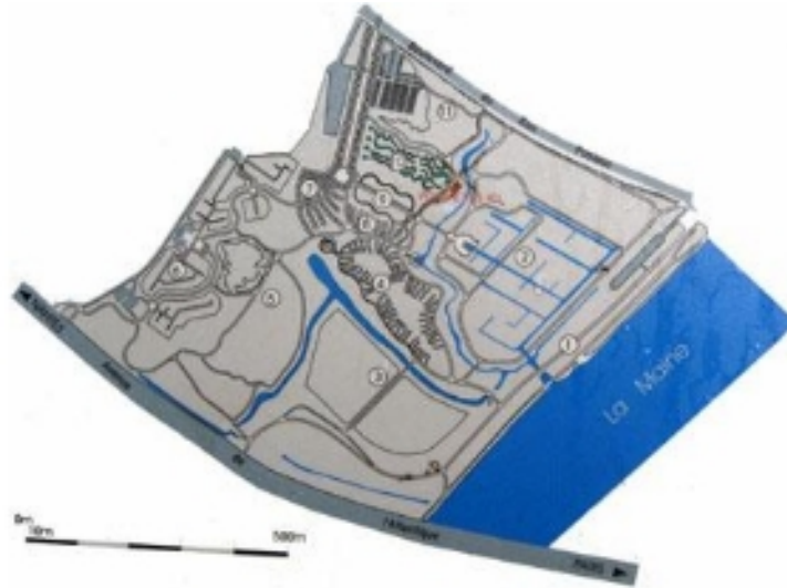
Plan à l'ouverture en 2000.