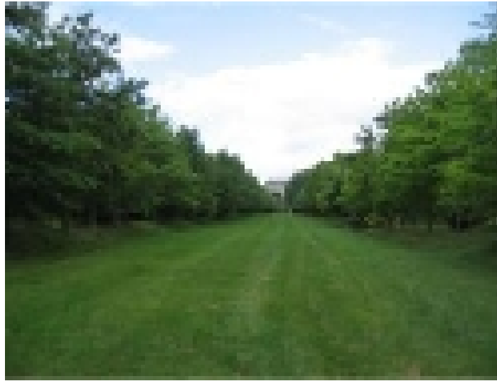
Tapis vert et allées de chênes.