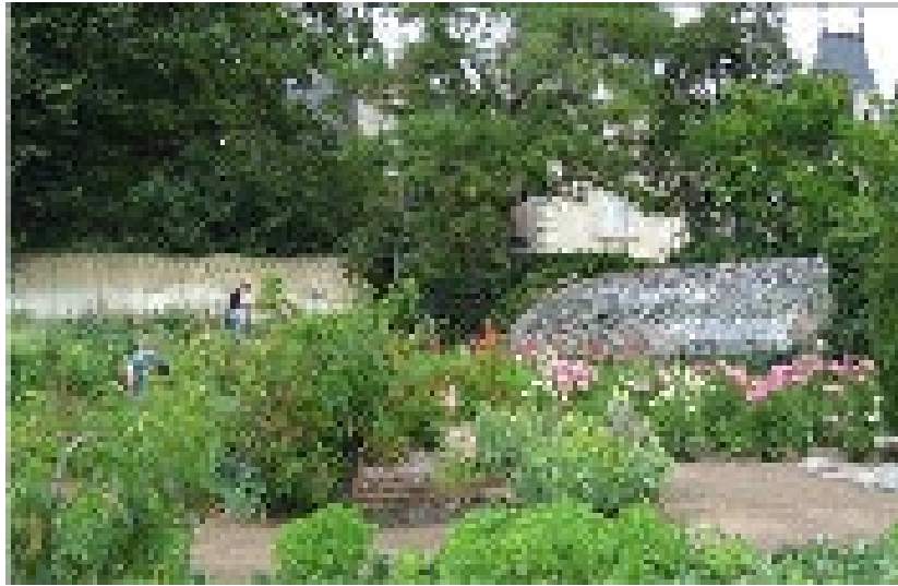
Les deux serres.