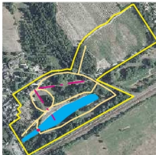
Photo aérienne 2002, retravaillée en 2007.