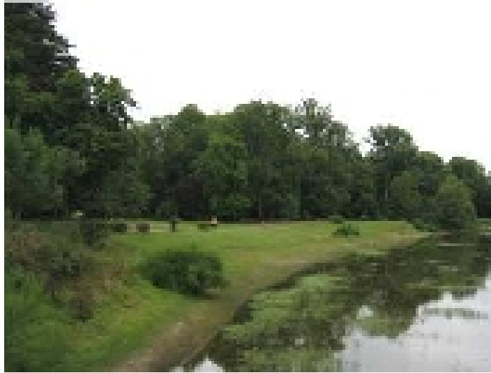
Le parc paysager.