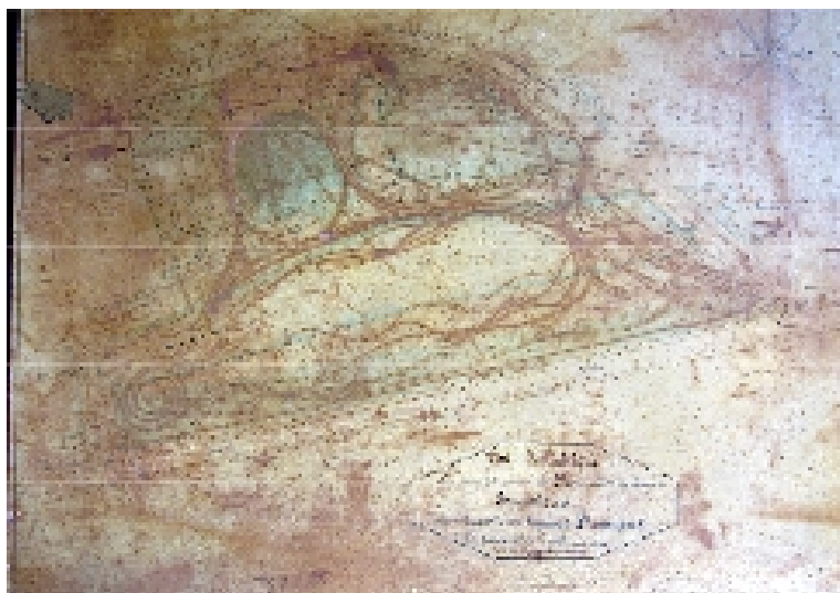
Plan, M. Martin, 1855.