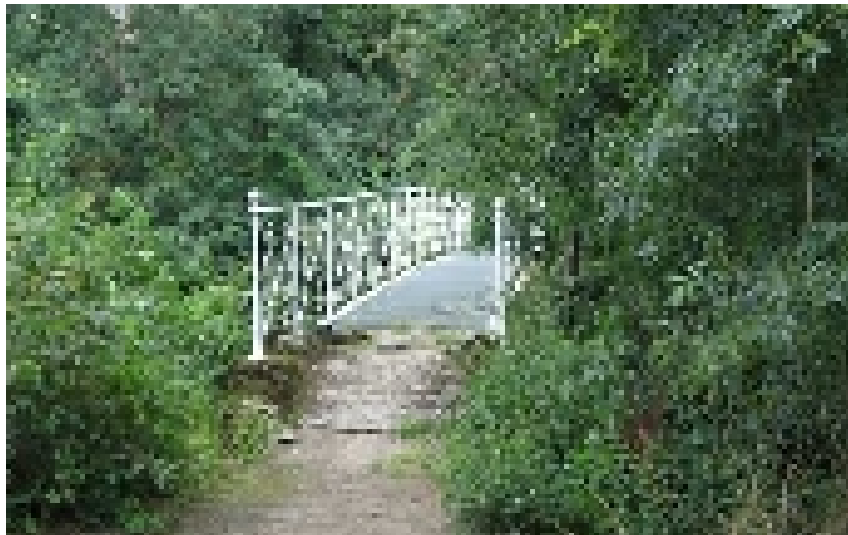
Le pont sur la boire.