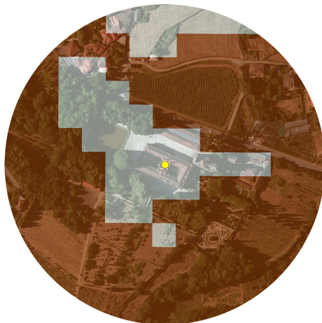
Carta de Exposições Solares