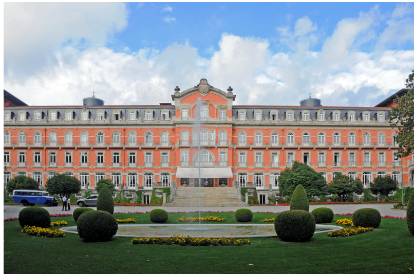
Carta de Bacias Visuais