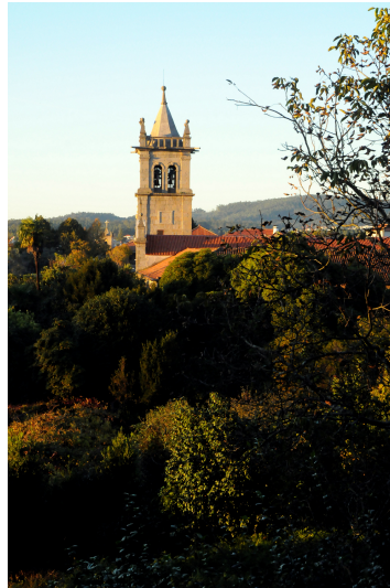
Carta de Bacias Visuais