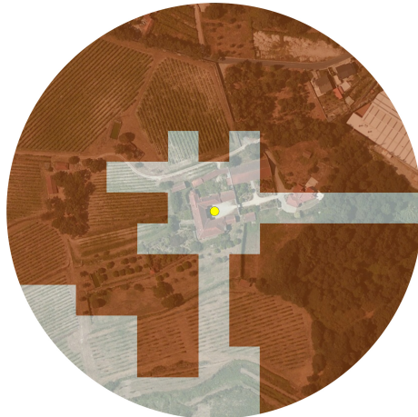
Carta de Exposições Solares