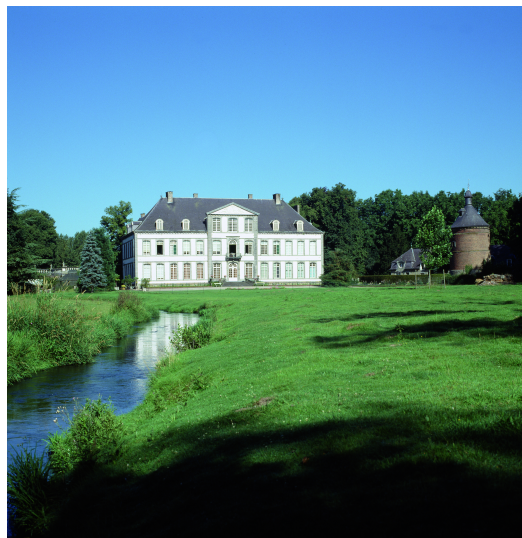
Sortie du couloir souterrain traversant le "Rocher" et débouchant dans la carrière, sous le chalet suisse. Carte postale, bromurite, éd. Nels, s.d.