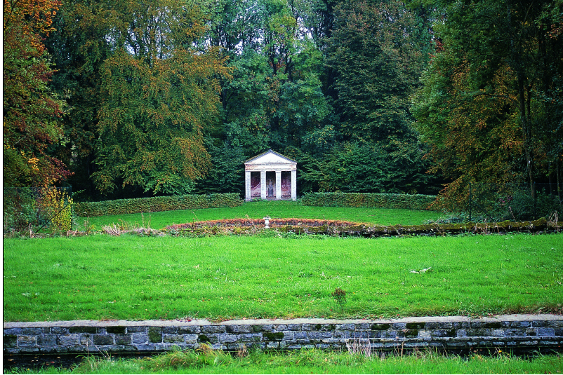
Fabrique en temple antique et son bassin axial terminant la perspective des jardins en terrasses.