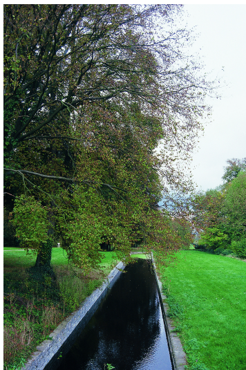
Le canal est ponctuellement surplombé par de beaux ensembles arborés comprenant des hêtres pourpres, des chênes pédonculés et des tilleuls.