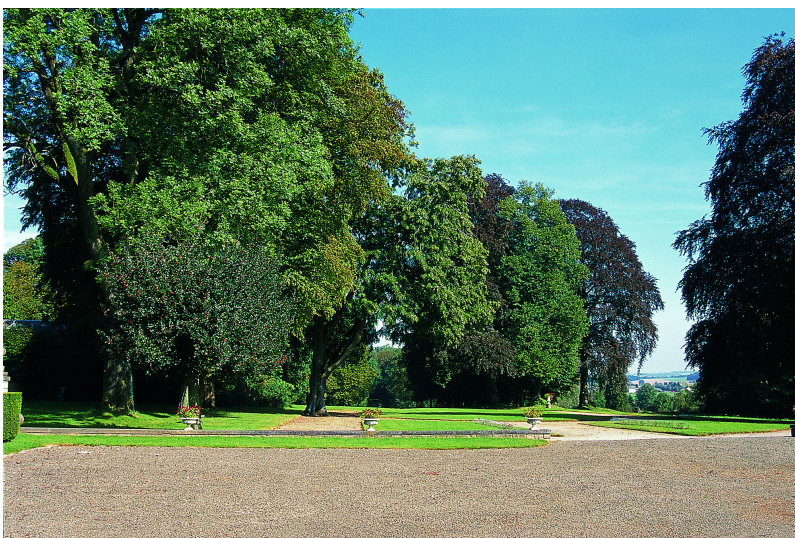
Grand ensemble arboré prolongeant la cour d'honneur.