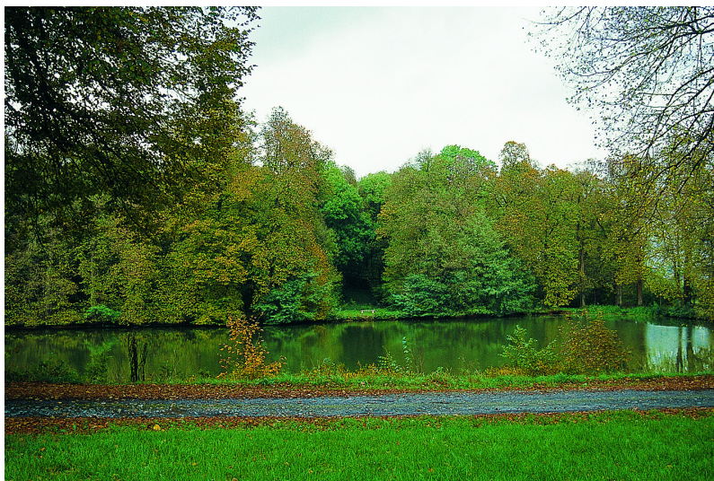
Le grand étang aval occupe le vallon au pied des jardins.