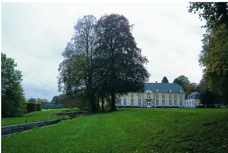
L'élégante demeure classique, précédée d'une cour d'honneur, domine d'anciens jardins réguliers. Sur la gauche, le canal.