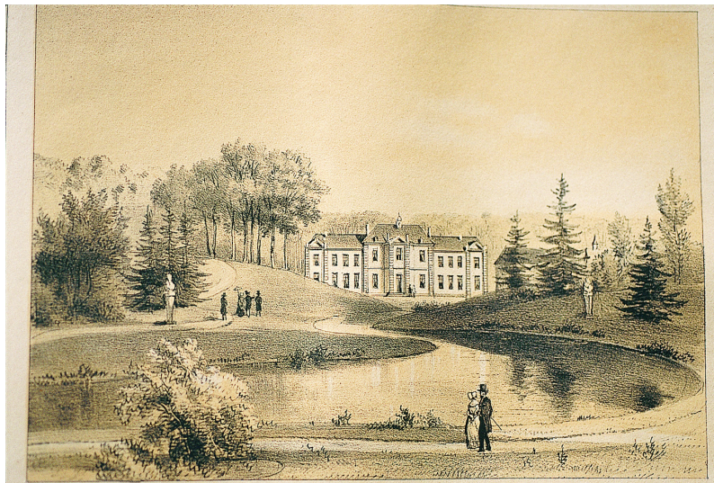
Château de Villers-Lez-Heest, commune de Warisoulx, canton de Dhuy appartenant à M. le Baron de Cuvelier de Warisoulx. Lithographie de T. Fourmois d'après un dessin de A. Vasse, [1844].