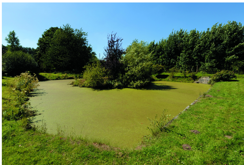
Etang créé dans la première moitié du XIXe siècle.