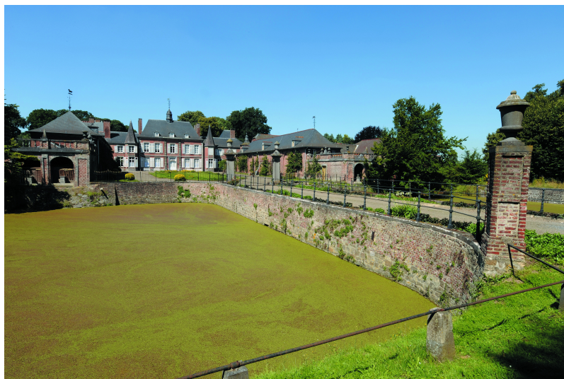
Un des deux bassins carrés précédant la cour d'honneur.