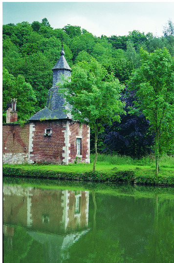
Tour-colombier et vivier du grand jardin fruitier.

Plan figuratif de l'enclos de l'abbaye et des environs. Première feuille du Recueil des cartes contenant les biens de l'Abbe [sic] de Floreffe, levés et arpentés à la requisition de Monsieur J.B. Dufresne très révérend Abbé de la susdite Abaye, par le soussigné géomètre de S.M. l'Empereur et Roi (...), commencé en l'an 177... et achevé en l'an... 178. Signé B. Paine [ou Gaine]. Plan manuscrit en couleurs, détail des jardins jouxtant la grande cour (AEN, Archives ecclésiastiques).