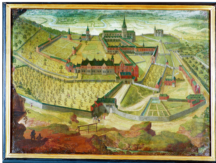
Huile sur toile marouflée, anonyme, s.d. [vers 1600]