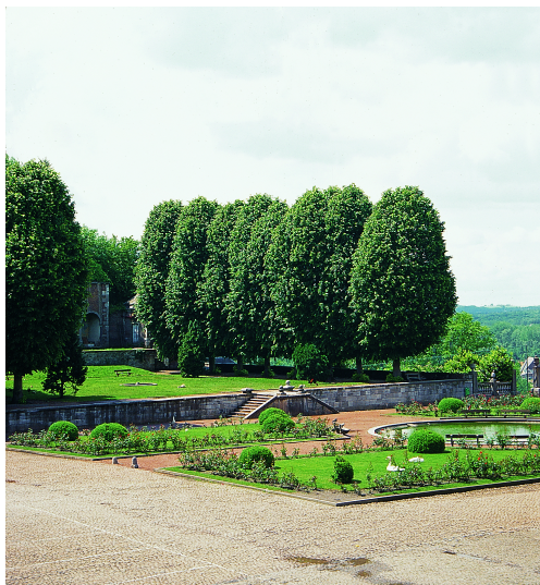
Jardin "suspendu" et les parterres de la cour Verte.