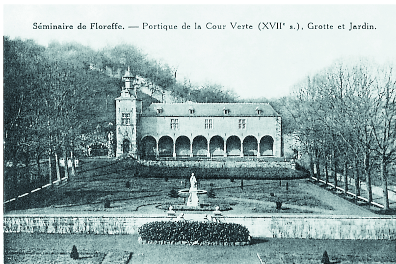
Jardin "suspendu" et sa galerie. Carte postale, s.d. [vers 1930]