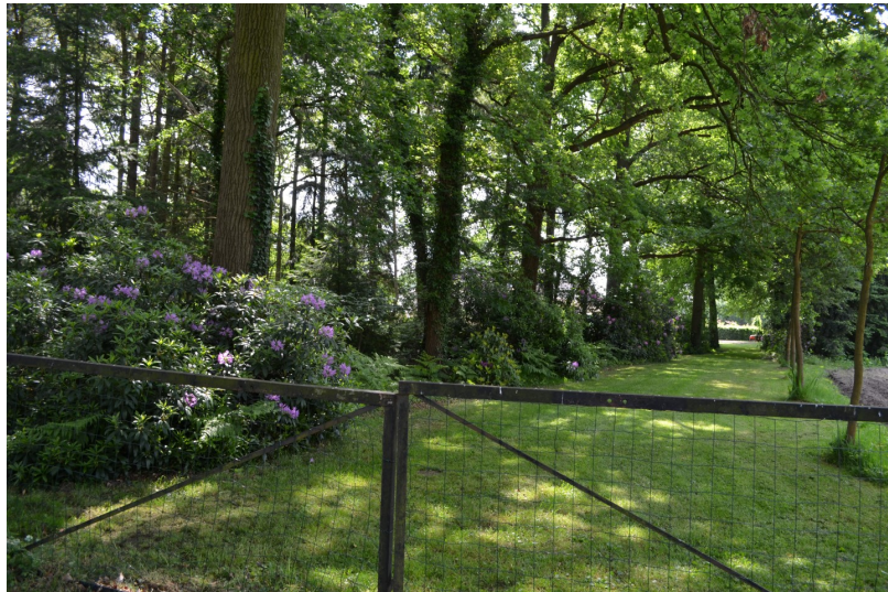
Kermt_Holrakerswinning_2