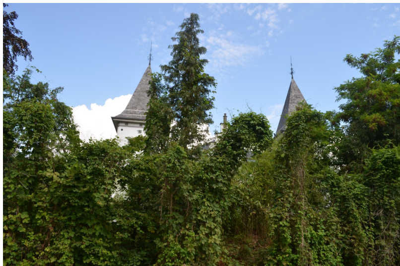
Kortessem_hoogveld_2