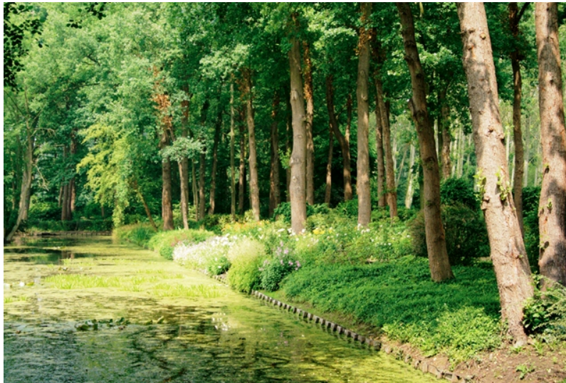
Het bosperceel over de gracht van Wermerbos (Vlaamse Gemeenschap, 11-06-2007,)