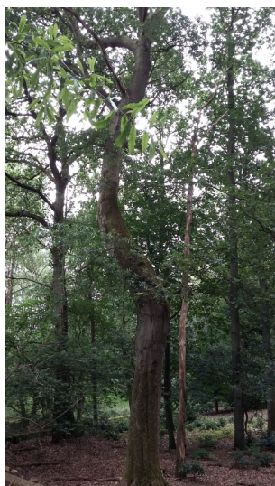
Quercus x schochiana.