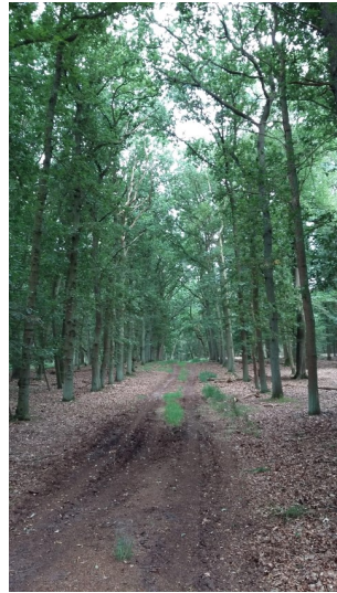
Eikendreef in het domein Masy.