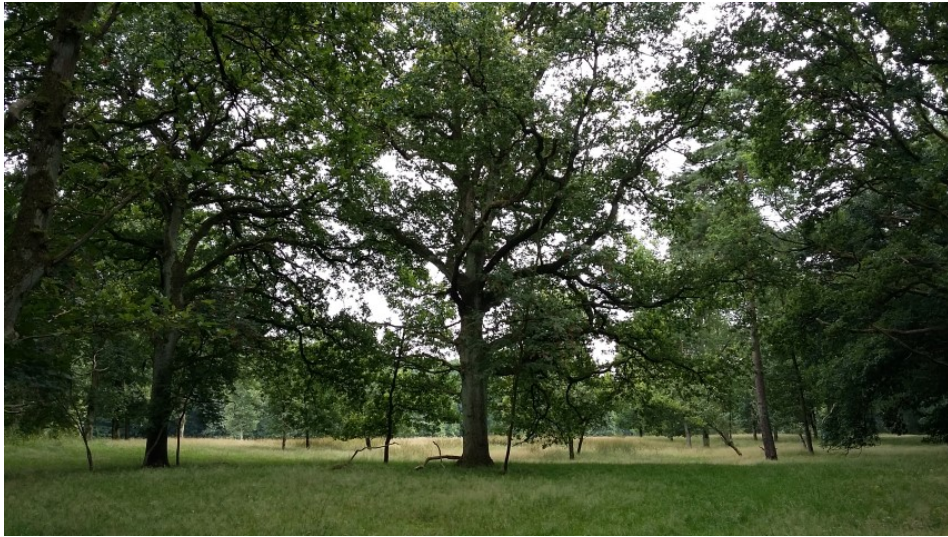
Schaapsweide in het domein Masy.