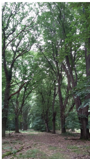
Dubbele toegangsdreef met alternerende aanplanting van linde en Amerikaanse eik.