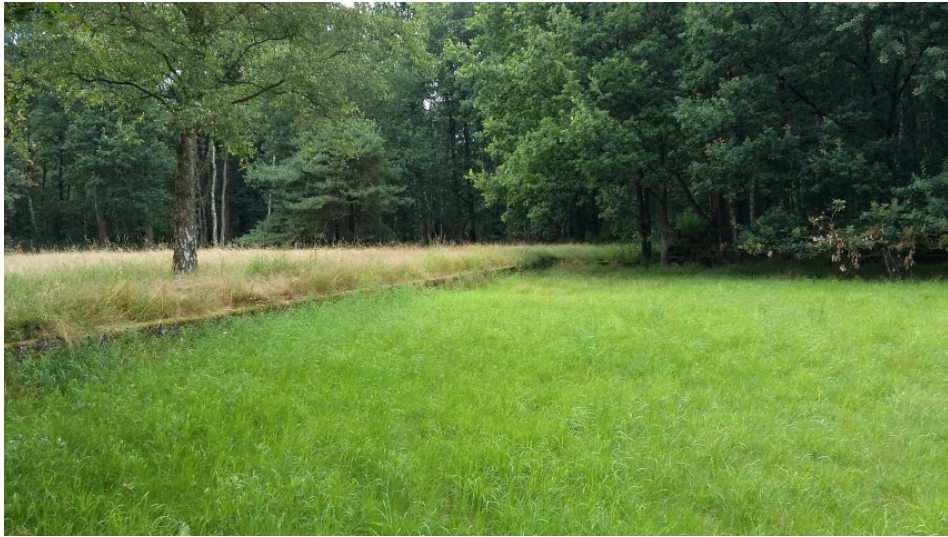
Voormalige moestuin van het domein Masy.