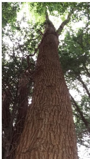
Iep in het domein Masy.