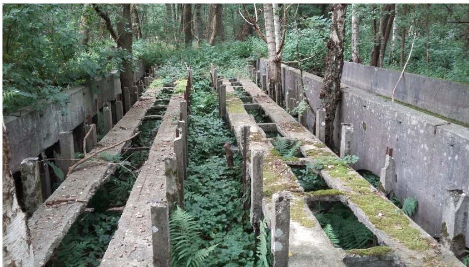
Funderingen van de serres in het domein Masy.