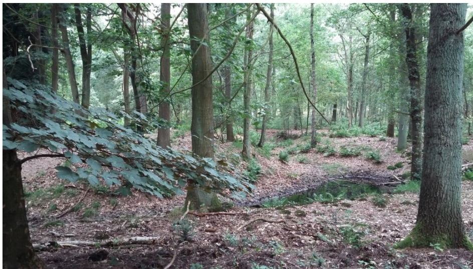
Gracht voor de toevoer van de vijver.