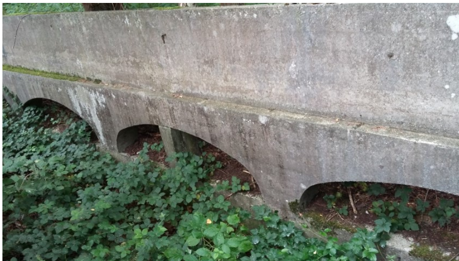
Detail van de serres in het domein Masy.