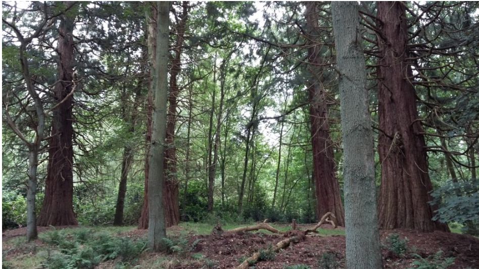
Bomengroep van sequoias.