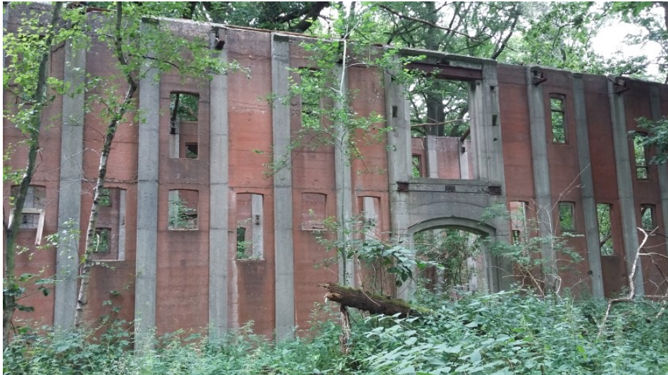
Restant van de paardenstallen in het domein Masy.