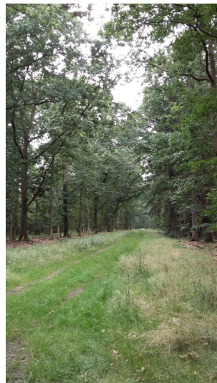
Dreef in het domein Masy.