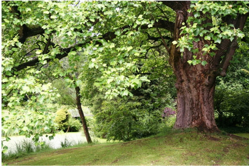
Sint-Niklaas Belsele Groenhof Amerikaanse tulpenboom stam