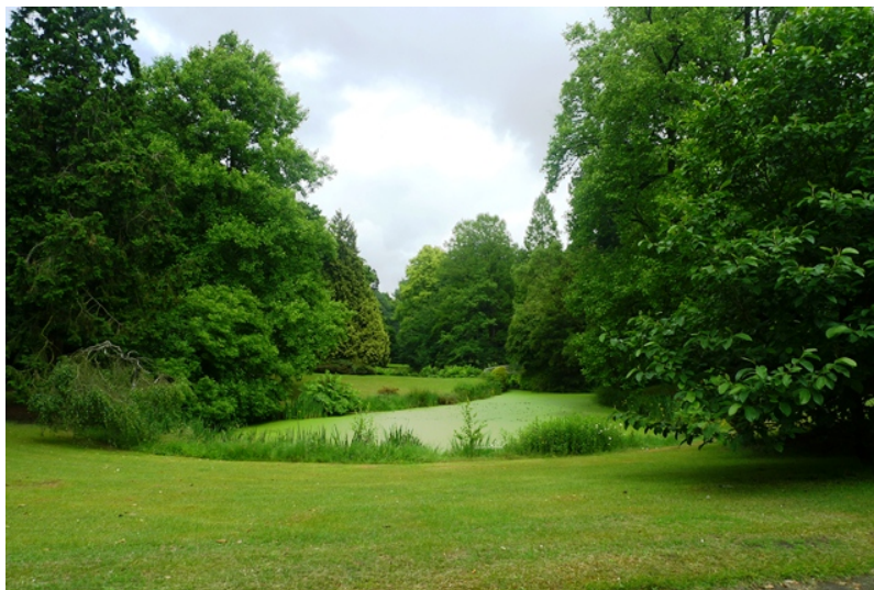
Sint-Niklaas Belsele Groenhof zicht over landschappelijk aangelegde tuin