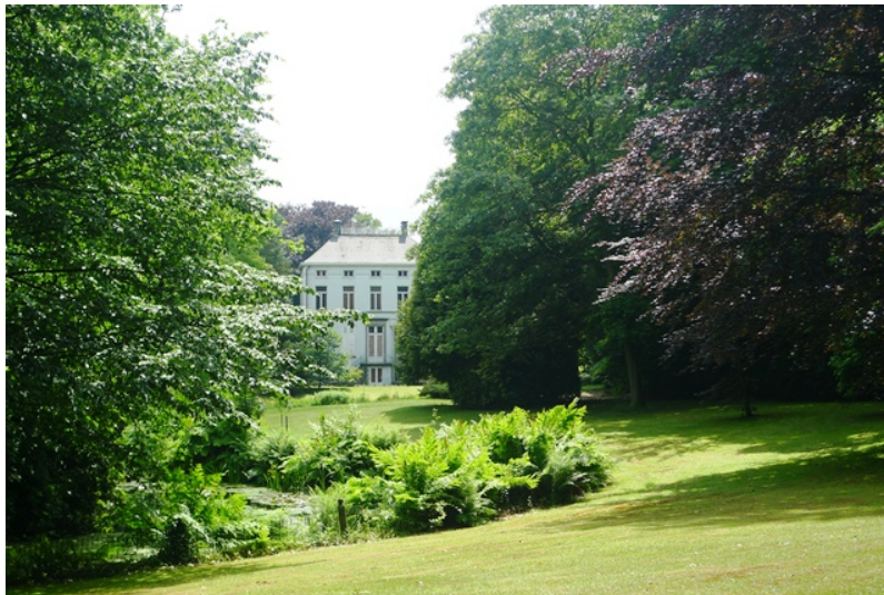
Sint-Niklaas Belsele Groenhof zicht over de serpentinevijver naar het herenhuis