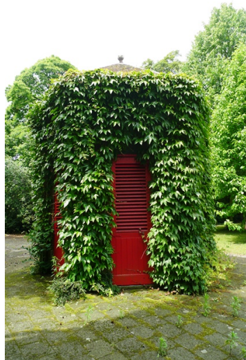
Sint-Niklaas Belsele Groenhof achthoekig paviljoentje toiletten