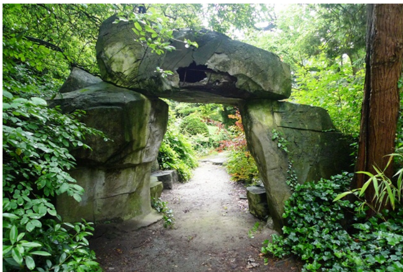
Sint-Niklaas Belsele Groenhof onderdoorgang in cementrustiek