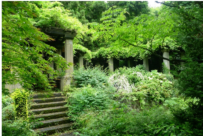
Sint-Niklaas Belsele Groenhof pergola