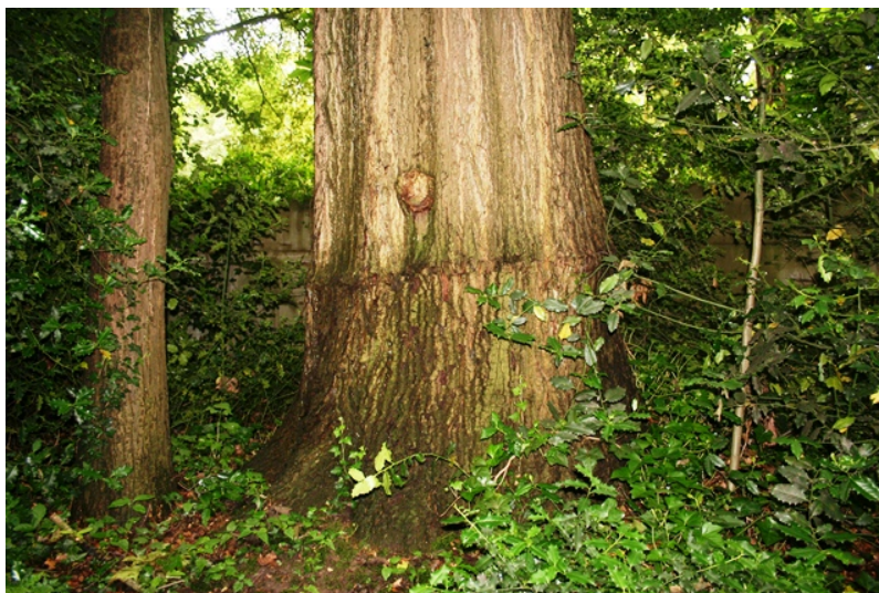
Sint-Niklaas Belsele Groenhof geente Amerikaanse eik op onderstam zomereik