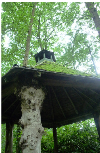
Sint-Niklaas Belsele Groenhof belvedère op heuveltje