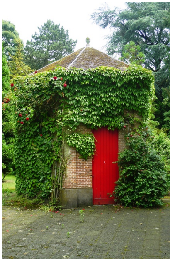
Sint-Niklaas Belsele Groenhof achthoekig paviljoentje kolenhok met berging