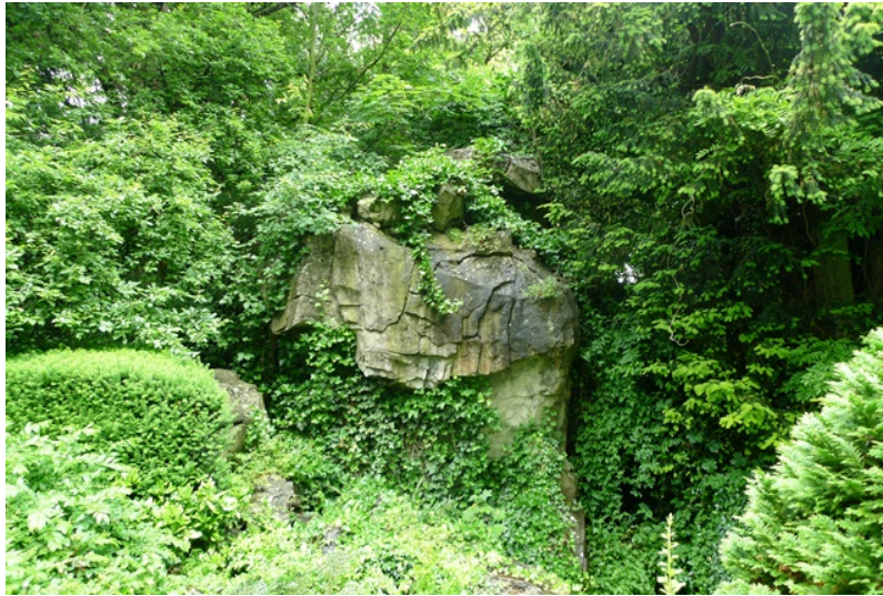
Sint-Niklaas Belsele Groenhof rotsen in cementrustiek