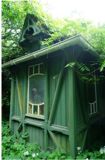
Sint-Niklaas Belsele Groenhof voormalige portiersloge SVK