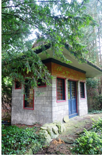
Sint-Niklaas Belsele Groenhof theehuis op een kunstmatige heuvel