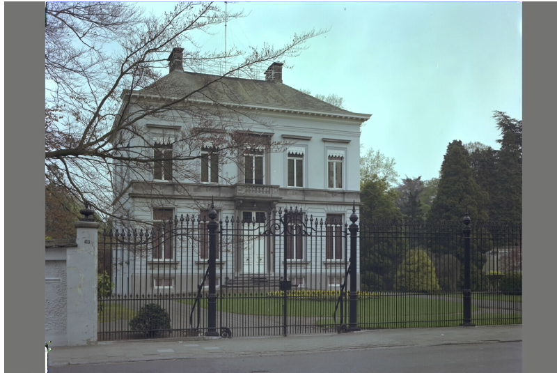
Sint-Niklaas Belseledorp 133 (Vlaamse Gemeenschap, 01-01-1970,)