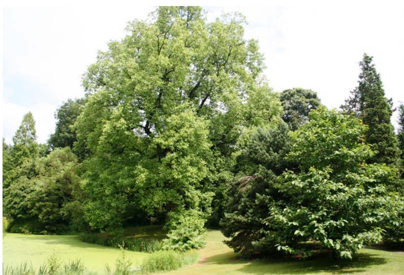
Sint-Niklaas Belsele Groenhof Amerikaanse tulpenboom