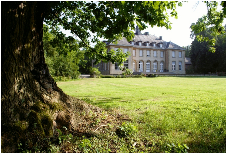
Het in 1920 heropgebouwde kasteel van Schiplaken herinnert aan het sobere classicistische landhuis van 1820