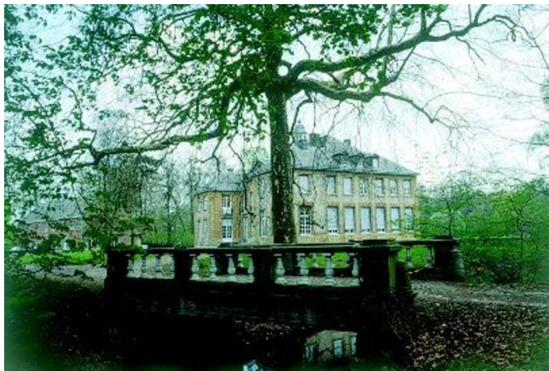
Het in 1920 gebouwde kasteel van Schiplaken en een tot "rivier" gerecycleerde relict van de oude ringgracht