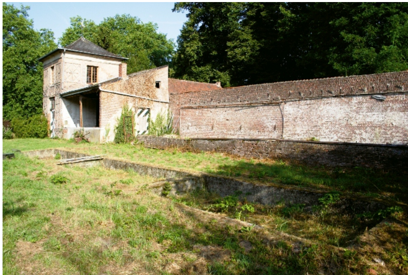
Oranjerie, serres en koude kassen aan de rand van de moestuin bij het kasteel van Schiplaken