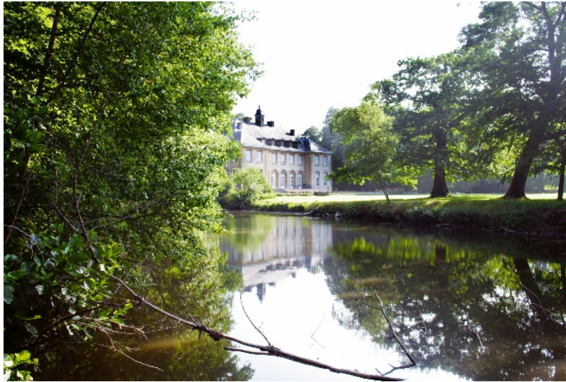
Kunstmatic rivierlandschap in de vroeglandschappelijke aanleg rond het kasteel van Schiplaken