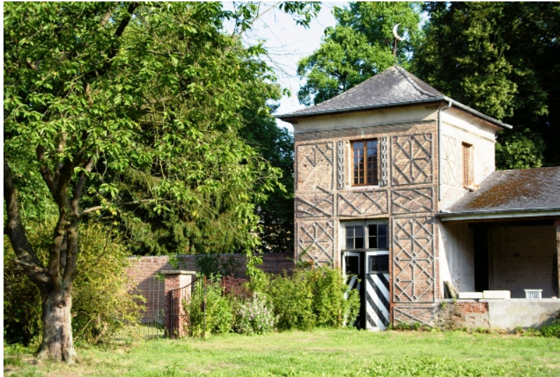
Het torenpaviljoen bij het kasteel van Schiplaken