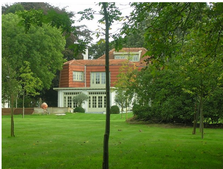
Dilbeek Zakstraat 81