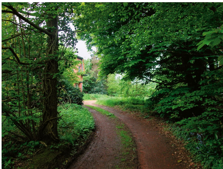
Laan naar villa De Smet