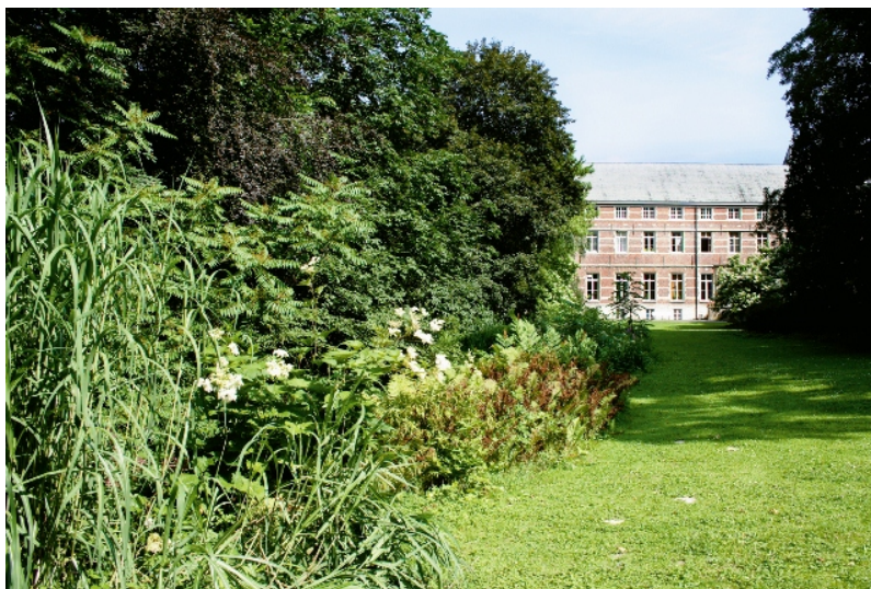
Het voormalige abdiskwartier van Vrouwenpark, nu klooster van de paters montfortanen vanuit het park