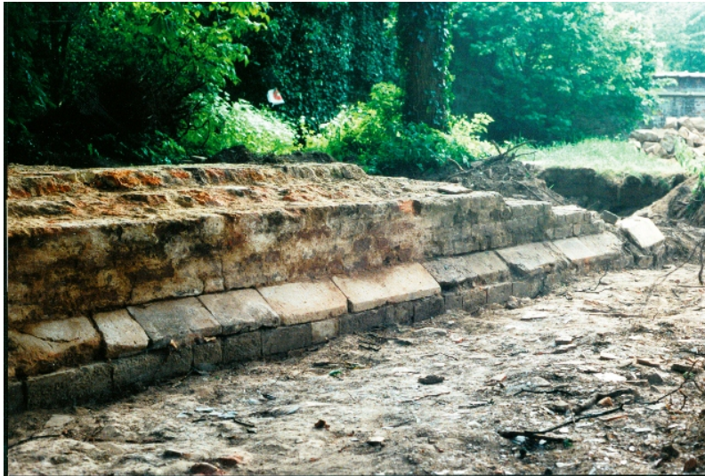
De in 1997 vrijgelegde noordwand van de 13de-eeuwse abdijkerk van Vrouwenpark