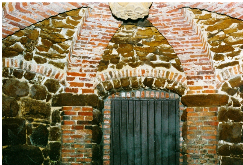
Het koepelgewelf met hergebruikte gewelfsleutel in het tuinpaviljoen in het voormalige abbdijdomein Vrouwenpark