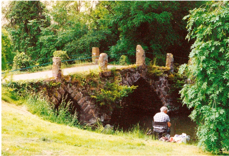
De "gotische" boogbrug bij het aalmoezeniershuis van de voormalige abdij Vrouwenpark