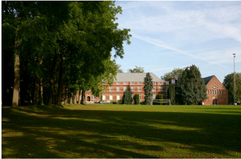
Rotselaar Aarschotsesteenweg 39