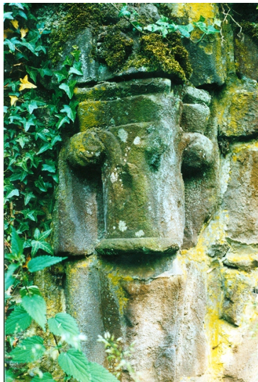
Recyclage van afbraakmateriaal van de abdij van Vrouwenpark in de "gotische" boogbrug bij het aalmoezeniershuis