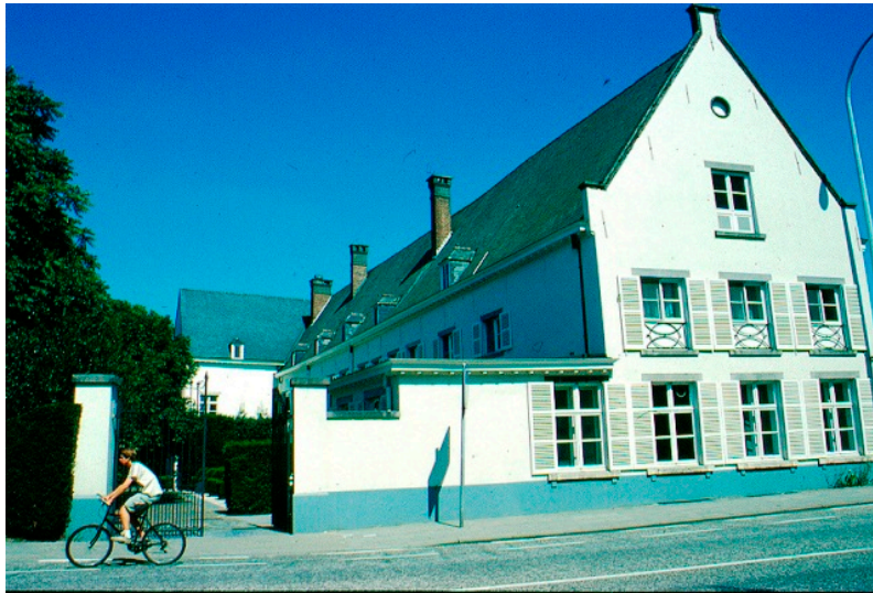
Cahier16_wittevrouwenklooster_01