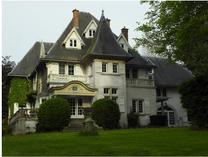
Oud-Heverlee Bogaardenstraat 45