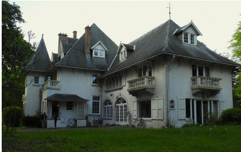
Oud-Heverlee Bogaardenstraat 45