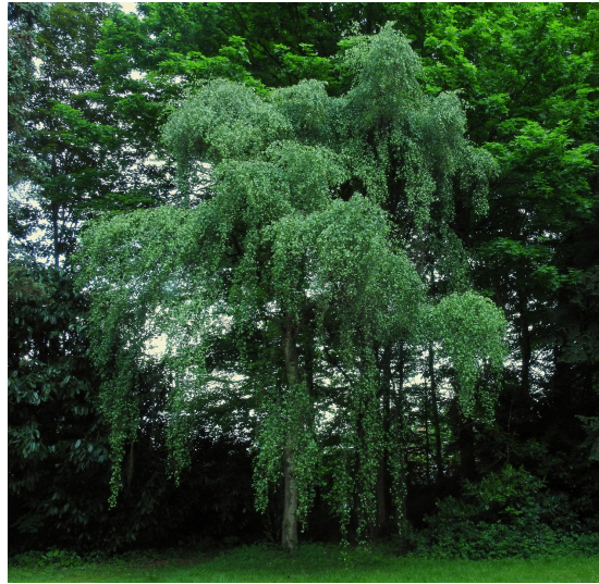
Oud-Heverlee Bogaardenstraat 45