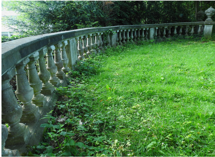
Oud-Heverlee Bogaardenstraat 45