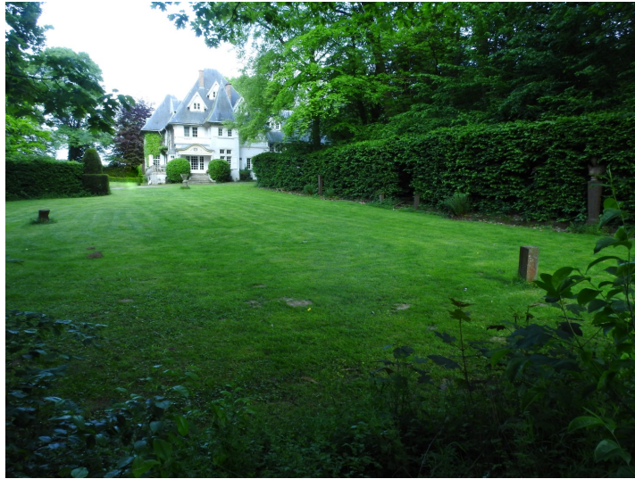
Oud-Heverlee Bogaardenstraat 45