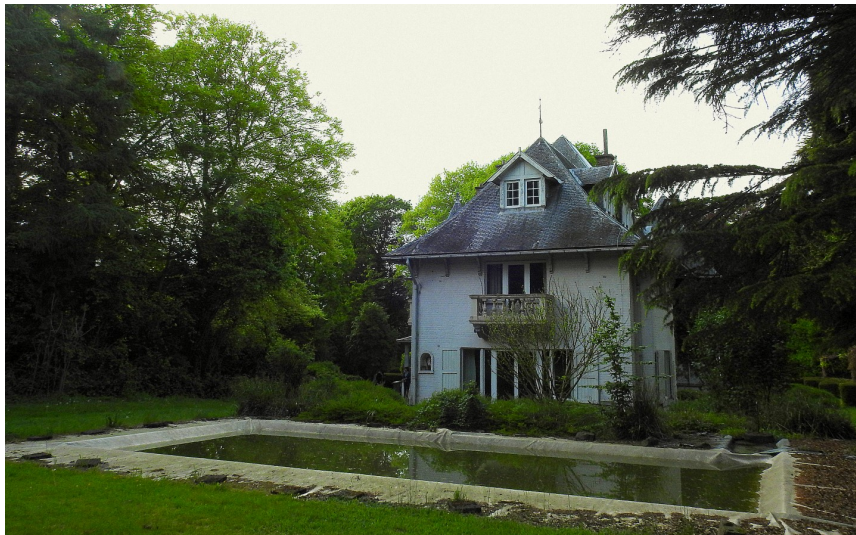
Oud-Heverlee Bogaardenstraat 45