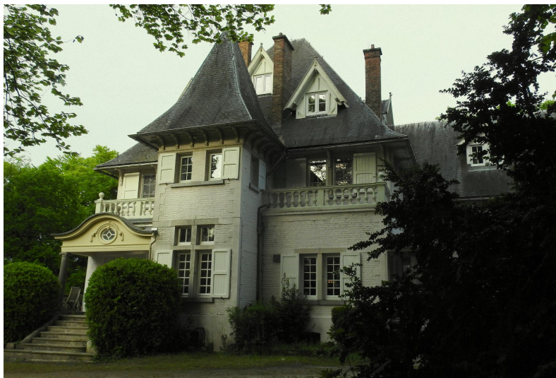
Oud-Heverlee Bogaardenstraat 45