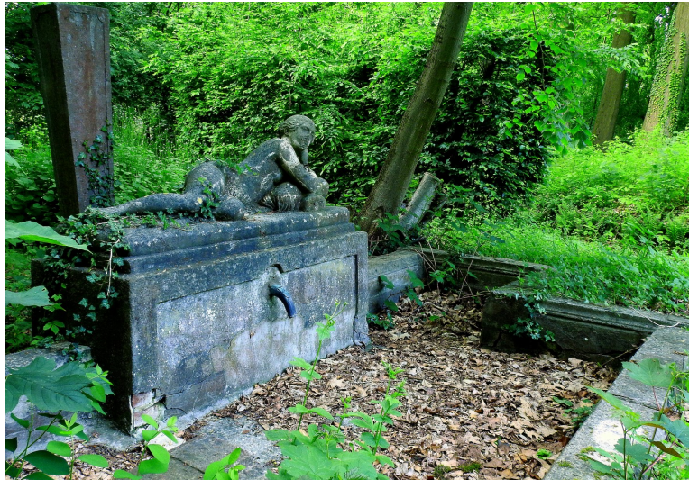
Oud-Heverlee Bogaardenstraat 45