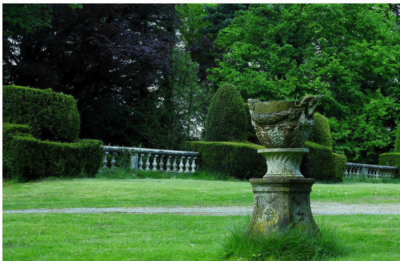
Oud-Heverlee Bogaardenstraat 45