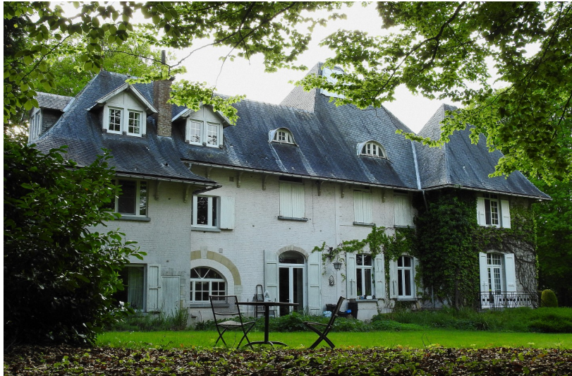
Oud-Heverlee Bogaardenstraat 45