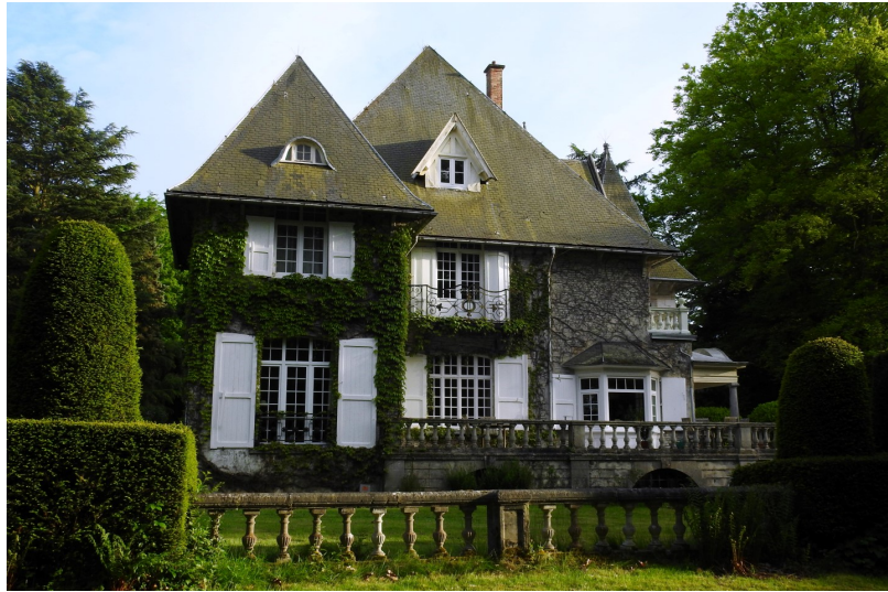
Oud-Heverlee Bogaardenstraat 45 (, 27-05-2015,)