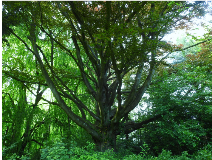
Oud-Heverlee Bogaardenstraat 45