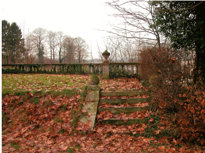
Een van de betonnen trapjes naar en de balustrade van het belvédèreterras