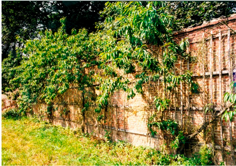
De 'fruitmuur' in de moestuin van het Gravenkasteel