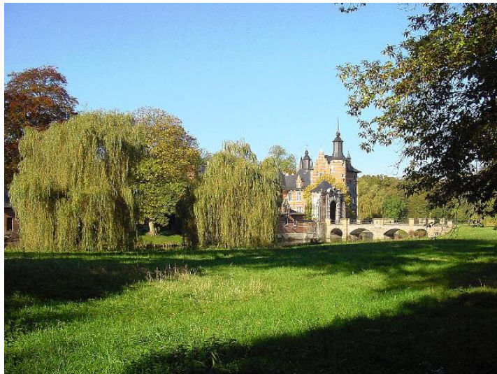
Landschappelijke aanleg ten zuidoosten van het Gravenkasteel