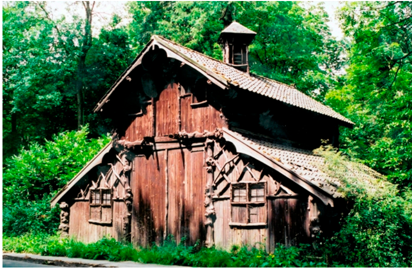
Domein van het Gravenkasteel: de schuur aan de Warandestraat, voorbeeld van pittoreske 'knoestarchitectuur'