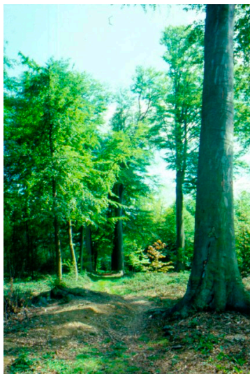
Overblijfsel van de beukendreven in het Gravenbos