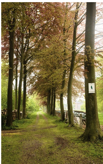
De laan tussen de vaart en het Gravenkasteel, die vroeger de hoofdtoegang vormde