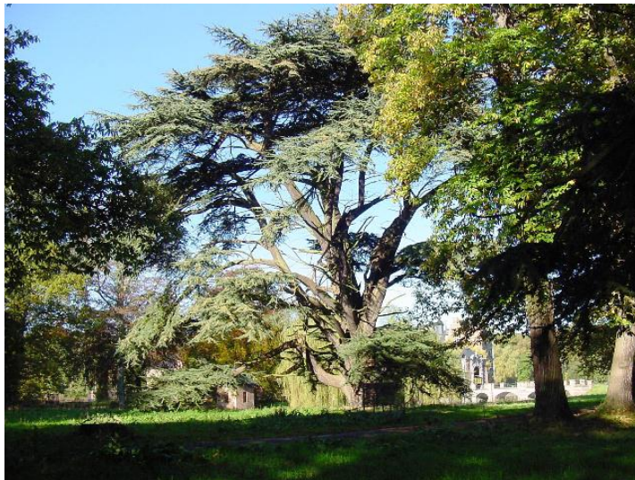
Libanonceder bij het Gravenkasteel