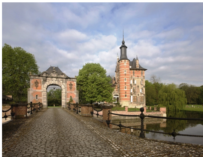
De brug en het poortgebouw bij het Gravenkasteel