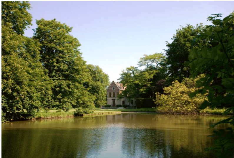
Kasteel Ter Balk, na 1900 verbouwd