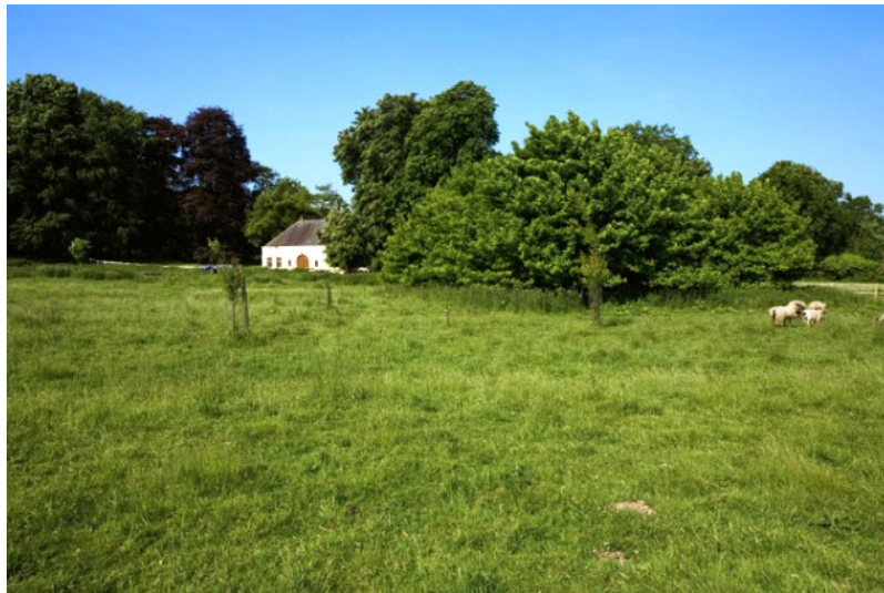
Kaukasische vleugelnoot bij kasteel Ter Balk