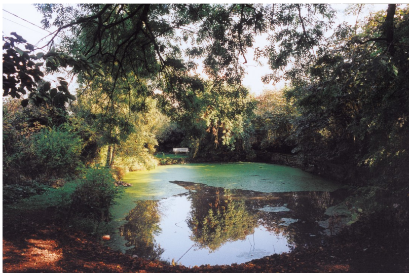
Het vijvertje in de pastorietuin van Kapellen