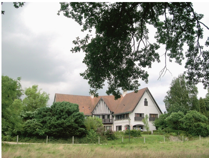
De villa van het Neromhof, heropgebouwd na de Tweede Wereldoorlog