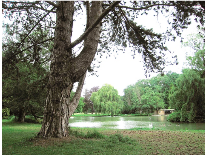
De rond 1905 aangelegde landschappelijke vijver bij het Neromhof