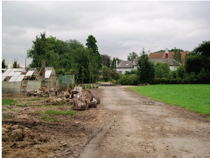
Voormalige moestuin van het Neromhof