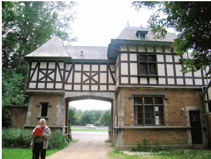
Het poortgebouw met de portiersloge bij het Neromhof werd in de jaren 1920 gebouwd