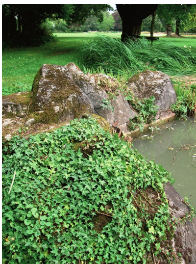
De met rotswerk gecamoufleerde overloop van de vijver bij het Neromhof