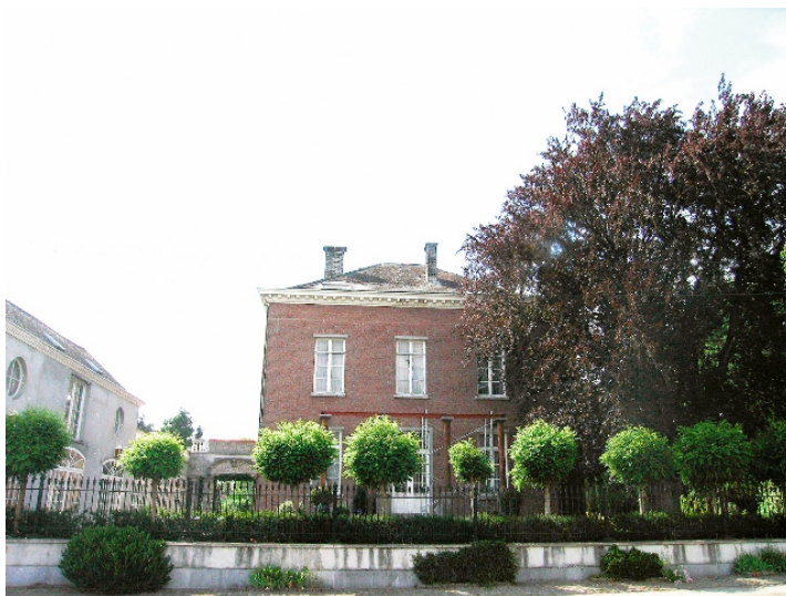
Villa ter Biest vanaf de straat