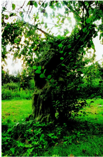
Merkwaardige boom: een enigszins kwijnende, knoestige treurhazelaar.