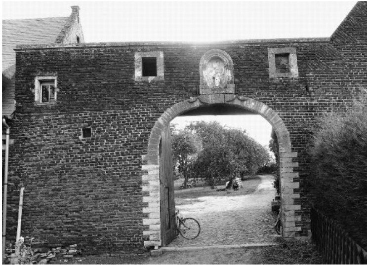
Toegangspoort naar het voormalig kloostercomplex.