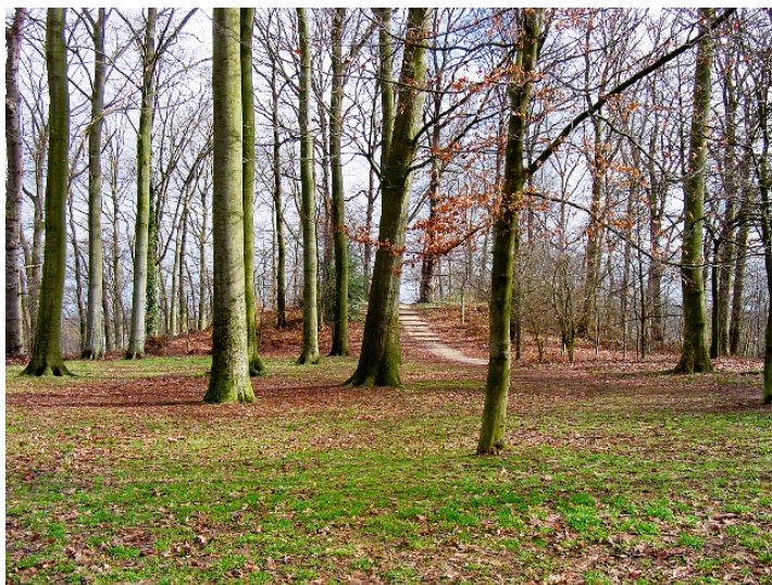
Oude donjonmotte op de Warandeheuvel te Diest, nu lindenprieel in landschappelijk park