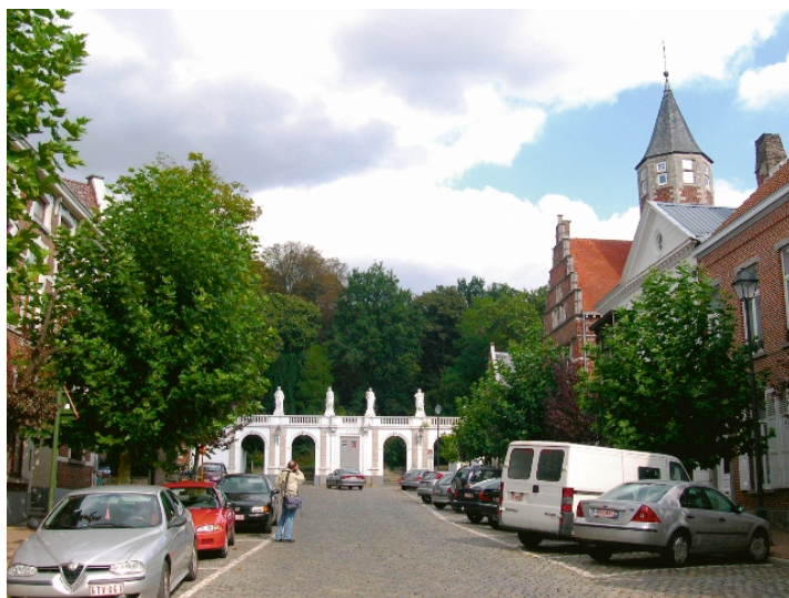
Herenhuis Verstappen in 1945 omgebouwd tot monumentale toegang van het stadspark te Diest, bekroond met beelden van het in 1956 afgebroken noordstation