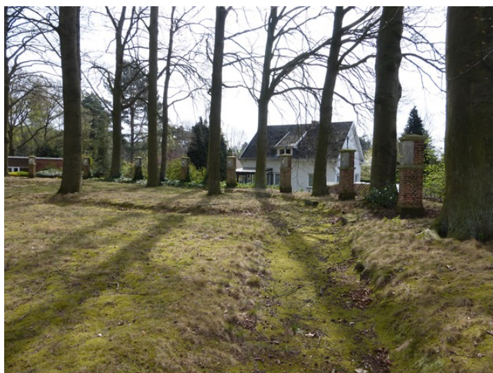
Rotselaar Steenweg op Wezemaal zonder nummer kapel