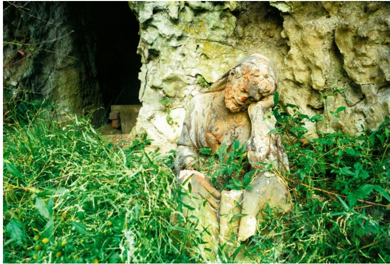
Slapende figuur aan een van de ingangen van het grotje bij de serpentinevijver in het park van Rega's Hof te Rotselaar-Heikant