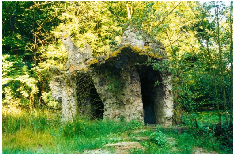
Het grotje bij de serpentinevijver (op die plaats genivelleerd) in het park van Rega's Hof