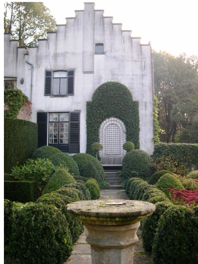
Met buxussen omzoomde parterre bij een voormalige aanhorigheid aan de noordrand van het Morettedomein