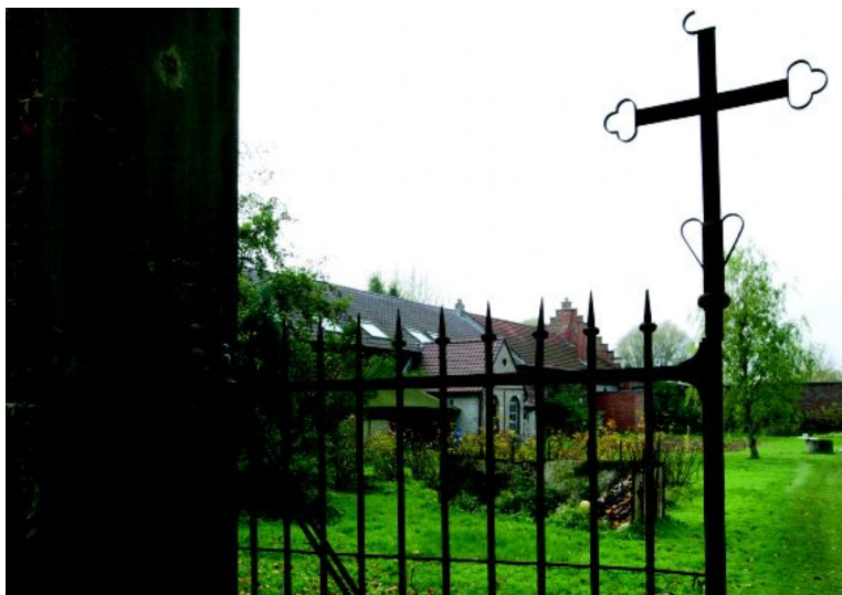
De ommuurde moestuin van het Kasteel van Klein Bijgaarden.