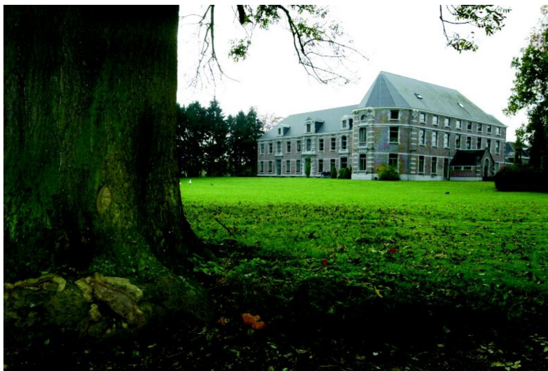
Het kasteel vanuit het park: de apsis van de oude kloosterkerk overleefde alle verbouwingen.