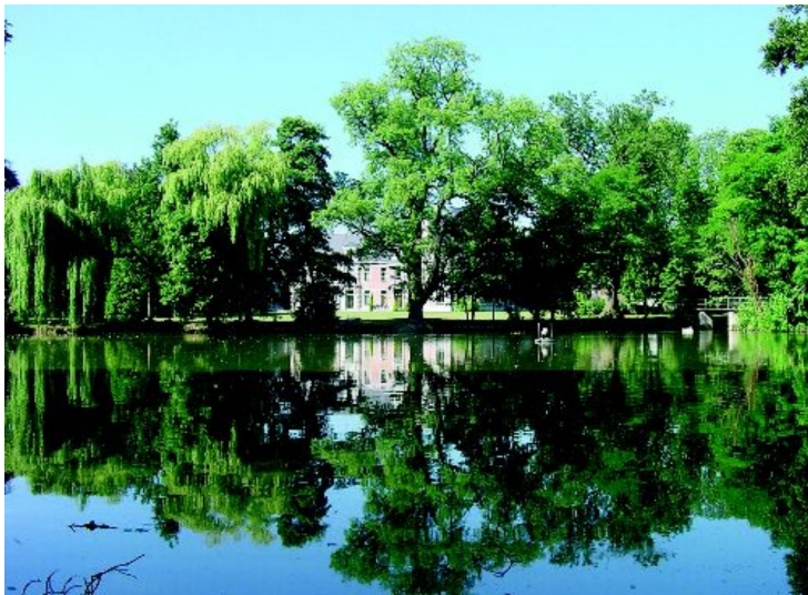
Het Kasteel van Klein Bijgaarden gezien van over de vijver.