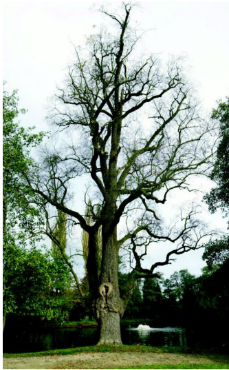
De monumentale smalbladige es bij de vijver van het Katseel van Klein Bijgaarden.