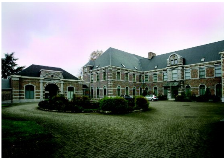
De jaarsteen '1866' boven de rondboogpoort tussen het neerhof en de erkoer verwijst naar de verbouwing die het kasteel zijn huidig neoclassicistisch uitzicht gaf.