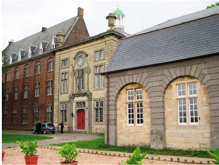
Neogotische kloostervleugel en relict van de Sint-Benedictuspoort, Benedictijnenabdij van Affligem