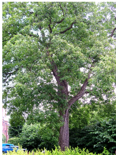
Notelaar bij de Sint-Benedictuspoort, Benedictijnenabdij van Affligem