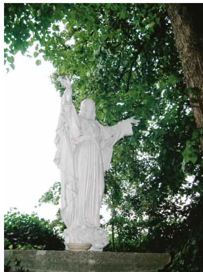
In 1923 geplaatst Heilig-Hartbeeld als eindpunt van een lindendreef, benedictijnenabdij Affligem