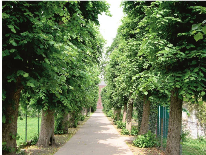
Lindendreef tussen de boerderij en benedictijnenabdij van Affligem