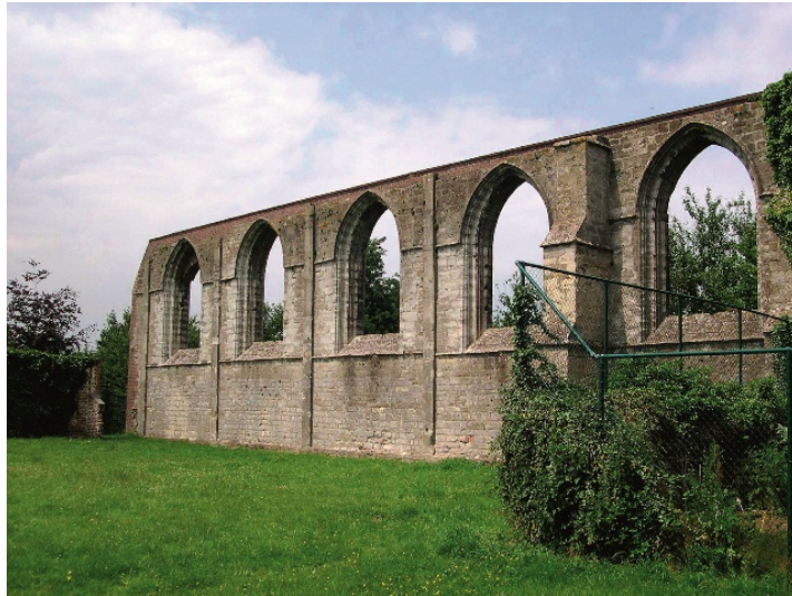
De gevelruïne na de restauratie van 1975, benedictijnenabdij van Affligem