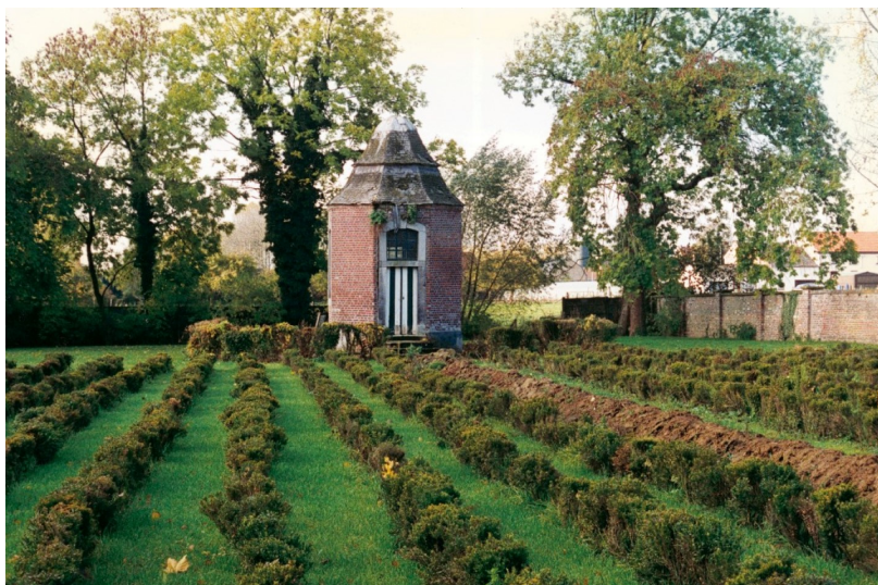
Het classicistisch tuinpaviljoen in de oude parterretuin achter de boerderij aan de Luikersteenweg 561 te Gelinden