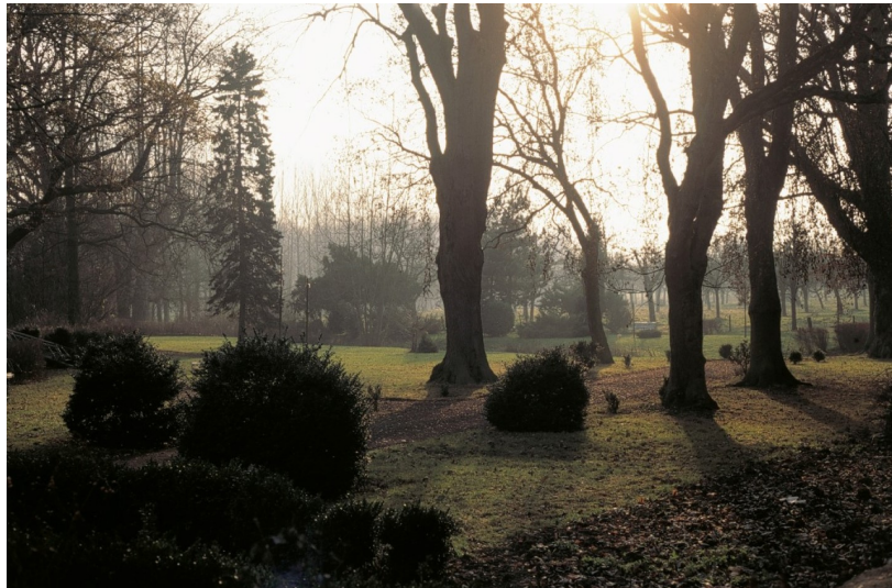
Het herenboerenparkje Luikersteenweg 561 in Gelinden