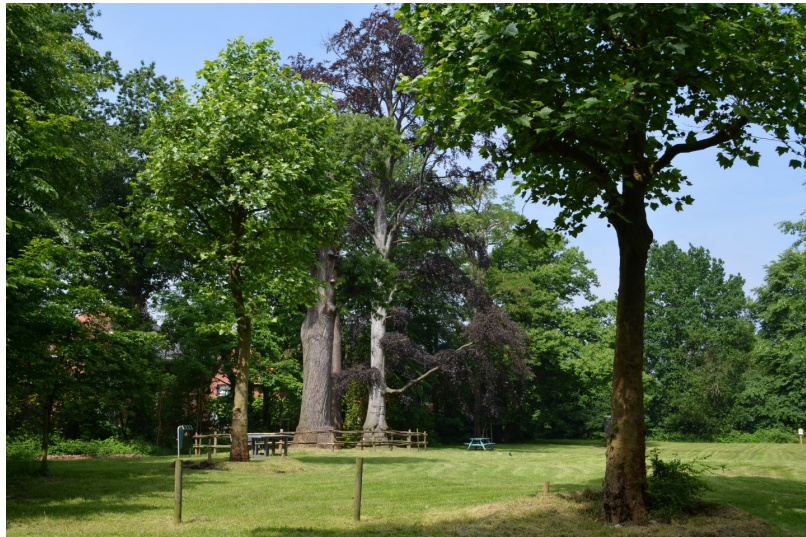
Parkje van de Kroonwinning.