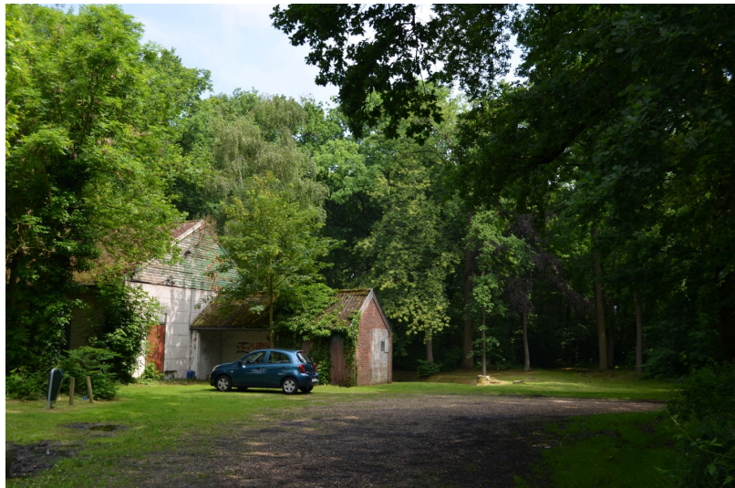
Parkje de Kroonwinning.