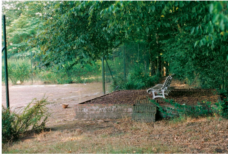
Het verhoogd terras met zitbank bij het tennisveld van Bleuterveld