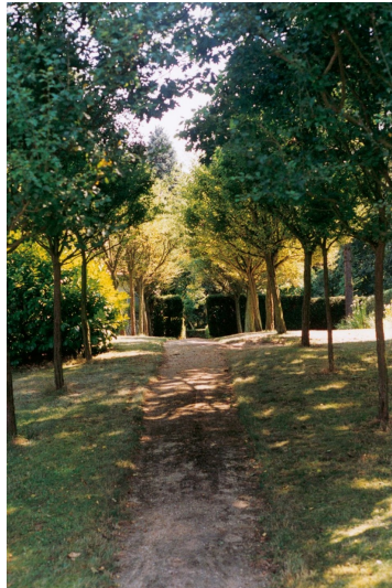
Een secundair laantje verbindt de watertuin met de boomgaard