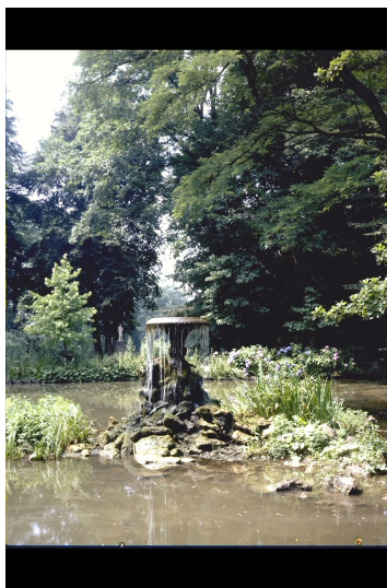
Zottegem, Grotenberge, Parkstraat 1