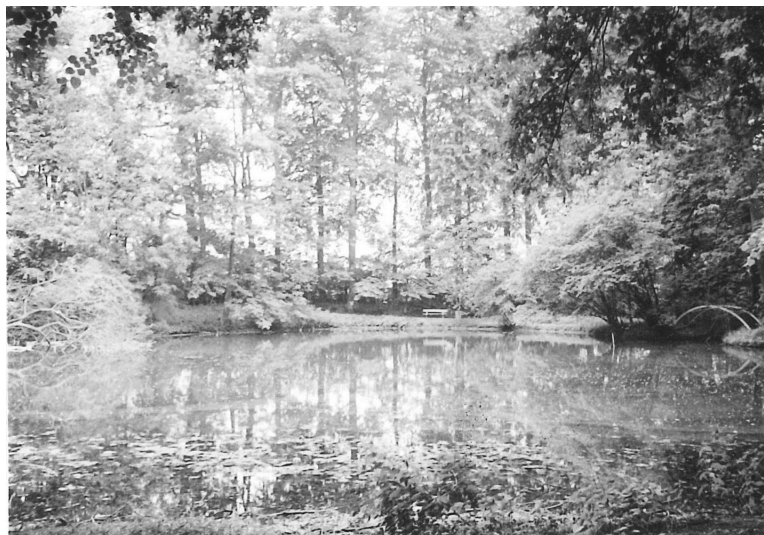
Zottegem Parkstraat 1 (Vlaamse Gemeenschap, 15-11-1974,)