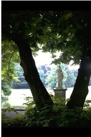
Zottegem, Grotenberge, Parkstraat 1