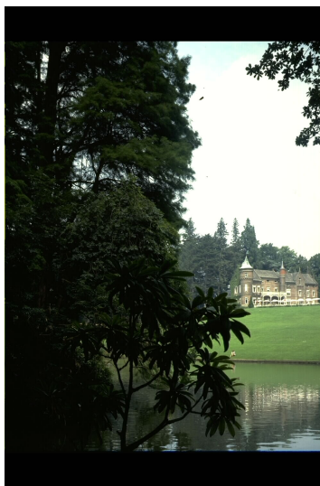
Zottegem, Grotenberge, Parkstraat 1