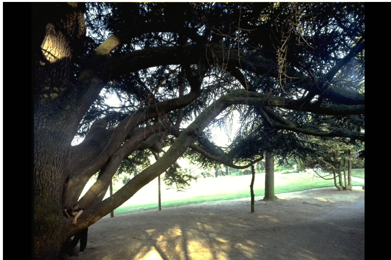
Zottegem, Grotenberge, Parkstraat 1