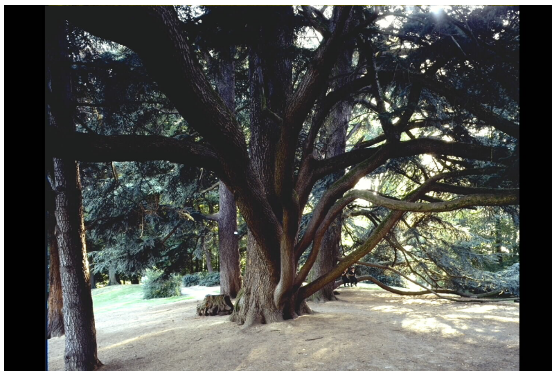
Zottegem, Grotenberge, Parkstraat 1