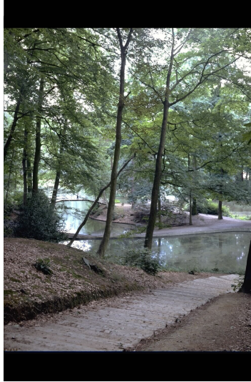
Zottegem, Grotenberge, Parkstraat 1