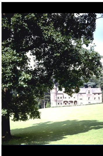
Zottegem, Grotenberge, Parkstraat 1