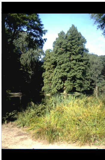
Zottegem, Grotenberge, Parkstraat 1