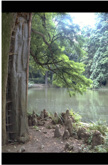
Zottegem, Grotenberge, Parkstraat 1