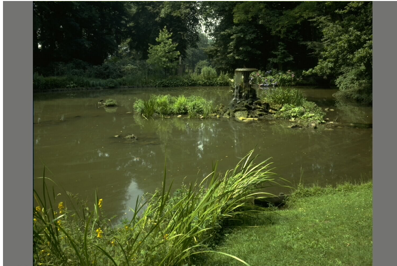
Zottegem, Grotenberge, Parkstraat 1 (, 01-01-1989,)