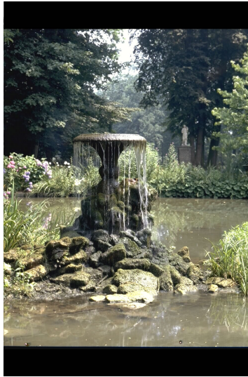
Zottegem, Grotenberge, Parkstraat 1