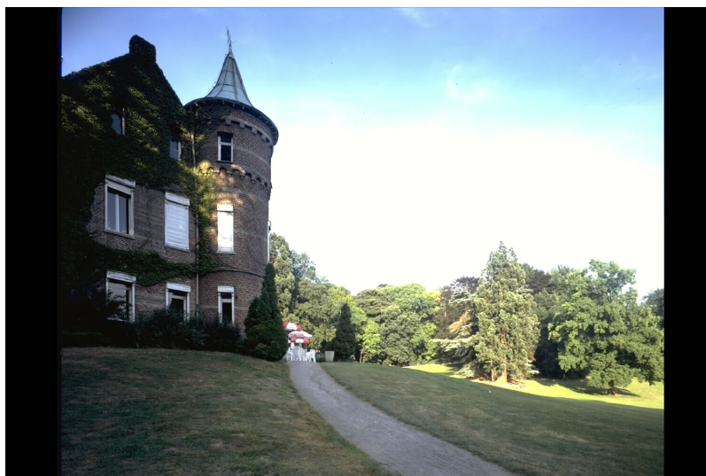
Zottegem, Grotenberge, Parkstraat 1