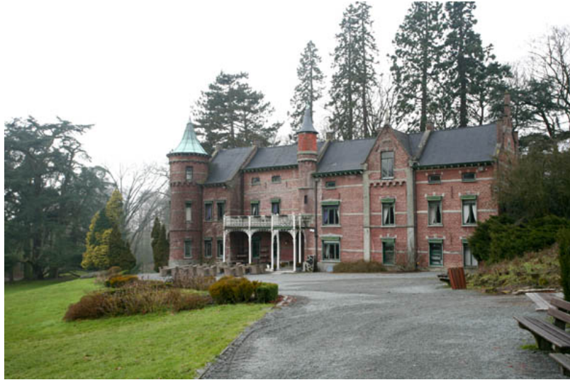
Zottegem Parkstraat 1