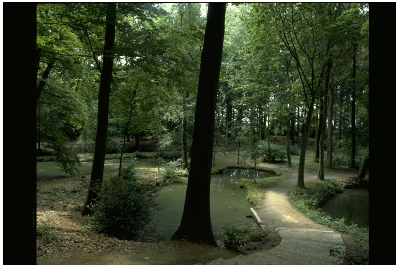
Zottegem, Grotenberge, Parkstraat 1