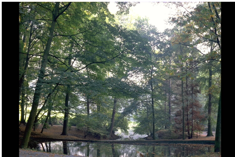
Zottegem, Grotenberge, Parkstraat 1