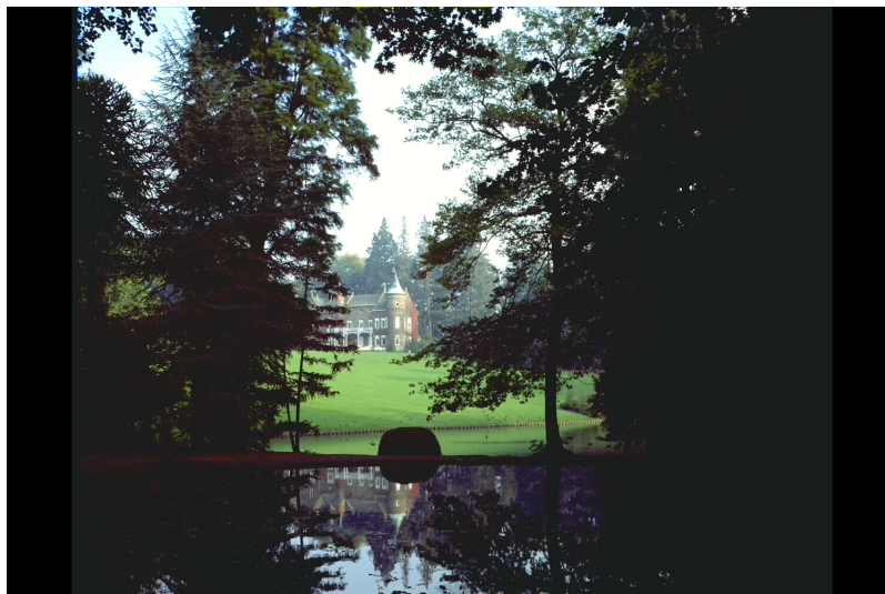
Zottegem, Grotenberge, Parkstraat 1