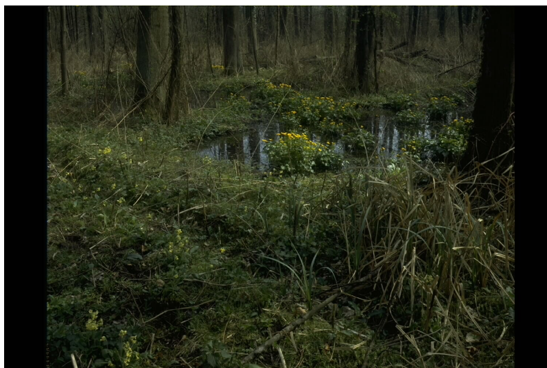
Zottegem, Grotenberge, Parkstraat 1