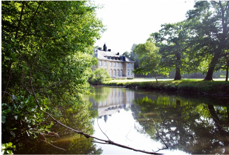
Kunstmatig rivierlandschap in de vroeglandschappelijke aanleg rond het kasteel van Schiplaken