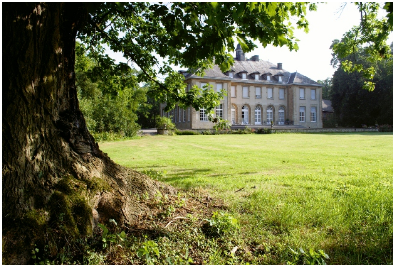
Het in 1920 heropgebouwde kasteel van Schiplaken herinnert aan het sobere classicistische landhuis van 1820