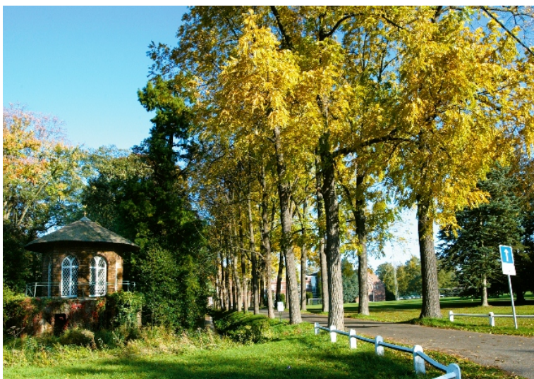
Oprijlaan met zwarte walnoot en het uit recuperatiemateriaal opgetrokken paviljoen in de landschappelijke tuin van Moerinckx in de voormalige abdij Vrouwenpark