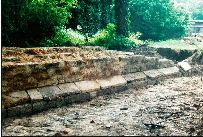
De in 1997 vrijgelegde noordwand van de 13de-eeuwse abdijkerk van Vrouwenpark