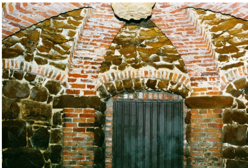
Het koepelgewelf met hergebruikte gewelfsleutel in het tuinpaviljoen in het voormalige abdijdomein Vrouwenpark