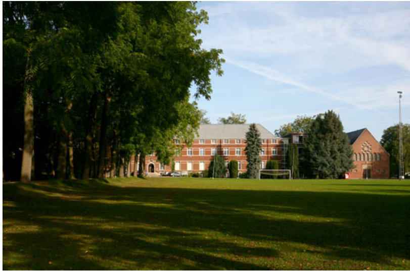
Rotselaar Aarschotsesteenweg 39