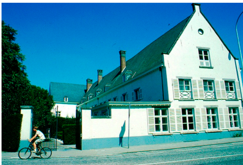
Cahier16_wittevrouwenklooster_01