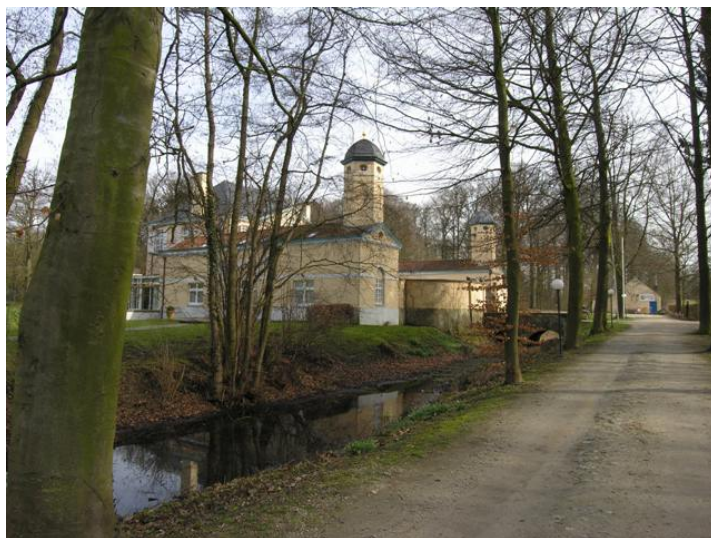
Dilbeek Lumbeekstraat 20