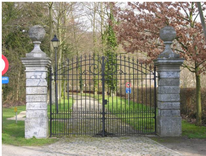
Dilbeek Lumbeekstraat 20