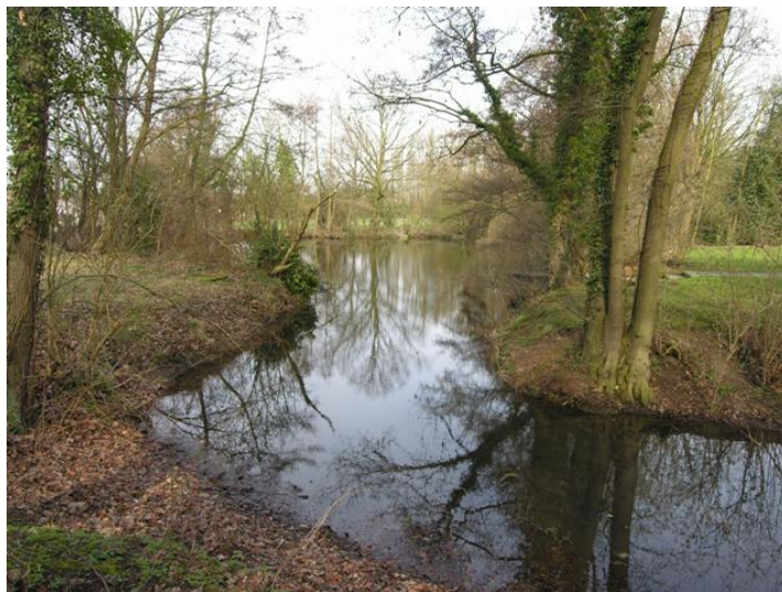
Dilbeek Lumbeekstraat 20