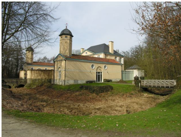
Dilbeek Lumbeekstraat 20