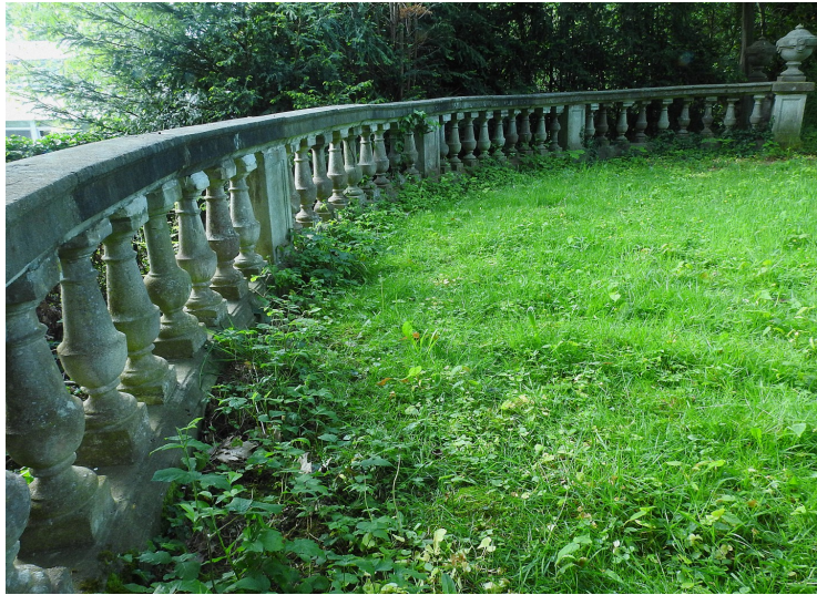
Oud-Heverlee Bogaardenstraat 45