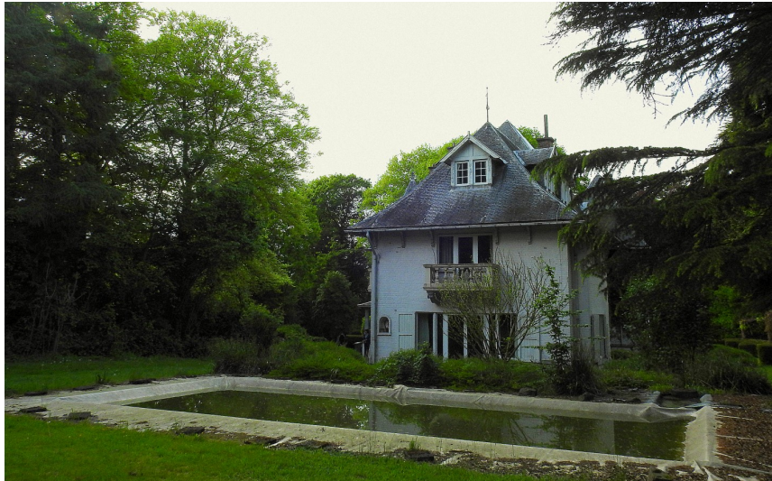
Oud-Heverlee Bogaardenstraat 45