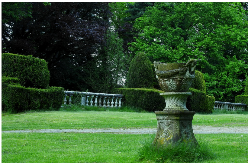
Oud-Heverlee Bogaardenstraat 45