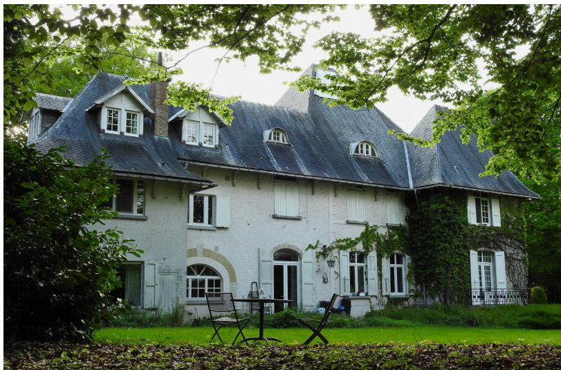
Oud-Heverlee Bogaardenstraat 45 (, 27-05-2015,)