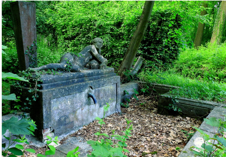
Oud-Heverlee Bogaardenstraat 45