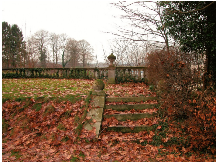
Een van de betonnen trapjes naar en de balustrade van het belvédèreterras