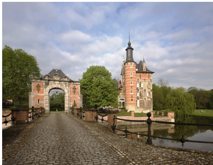
De brug en het poortgebouw bij het Gravenkasteel