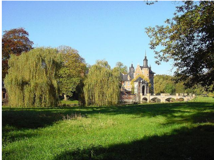
Landschappelijke aanleg ten zuidoosten van het Gravenkasteel