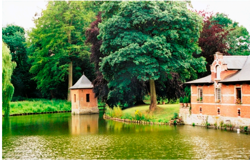
Het paviljoentje in de zuidoosthoek van het kasteleiland, mogelijk relict van de verdwenen slotkapel bij het Gravenkasteel