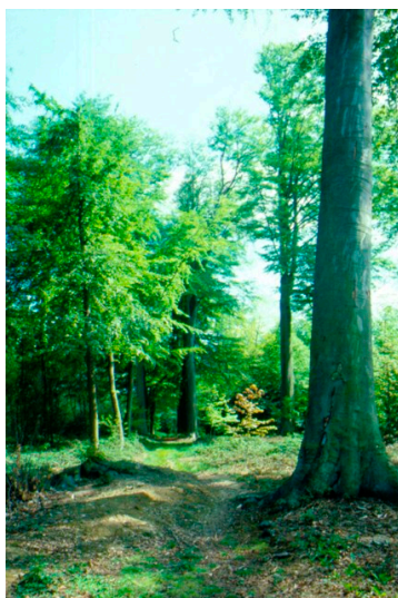
Overblijfsel van de beukendreven in het Gravenbos