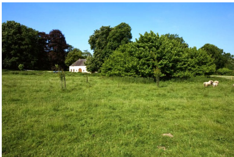
Kaukasische vleugelnoot bij kasteel Ter Balk