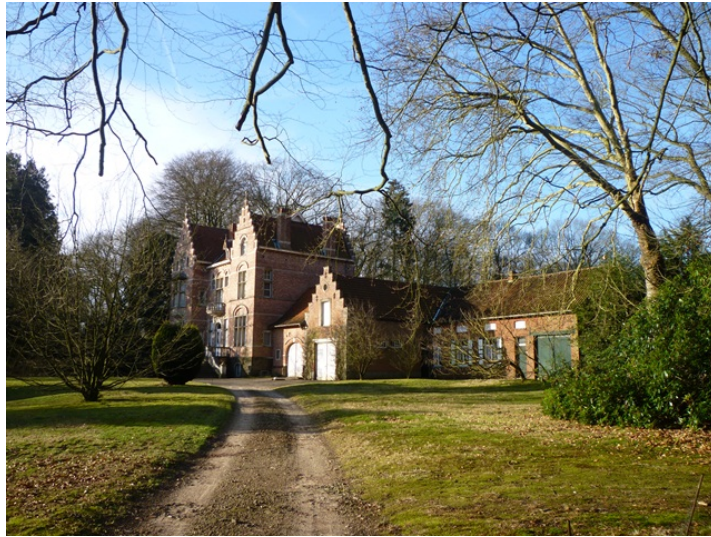
Tremelo Hilstraat 18-20