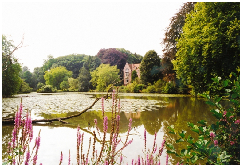
Het na de Eerste Wereldoorlog heropgebouwde kasteel van Fonteyn van over de vijver, oorspronkelijk een turfkuil