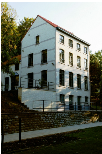
De "Roze Villa" Coremans te Aarschot werd gebouwd rond 1870